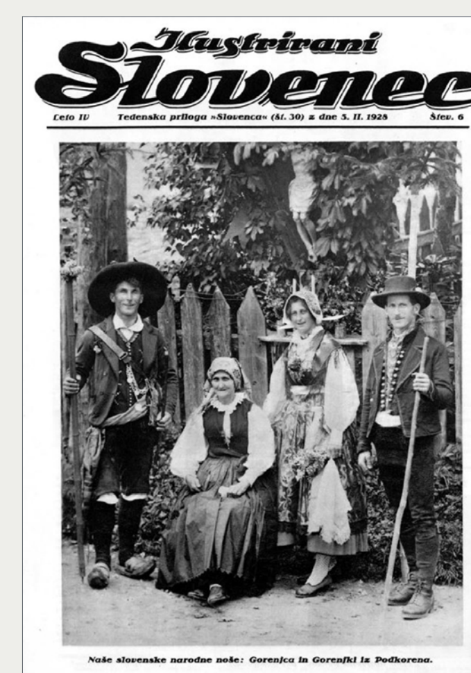
Slika 7: »Naše slovenske narodne noše: Gorenjca in Gorenjki iz Podkorena«

V slovenski likovni umetnosti tridesetih let so se po desetletju, ki sta ga na likovnem področju zaznamovala ekspresionizem in nova stvarnost, ponovno obudile vrednote zmernega modernizma in ideje iskanja nacionalnega v umetnosti. Slovenska umetnost, sicer vpeta v jugoslovanske umetnostne tokove, je sledila vsesplošnemu obratu k realizmu.