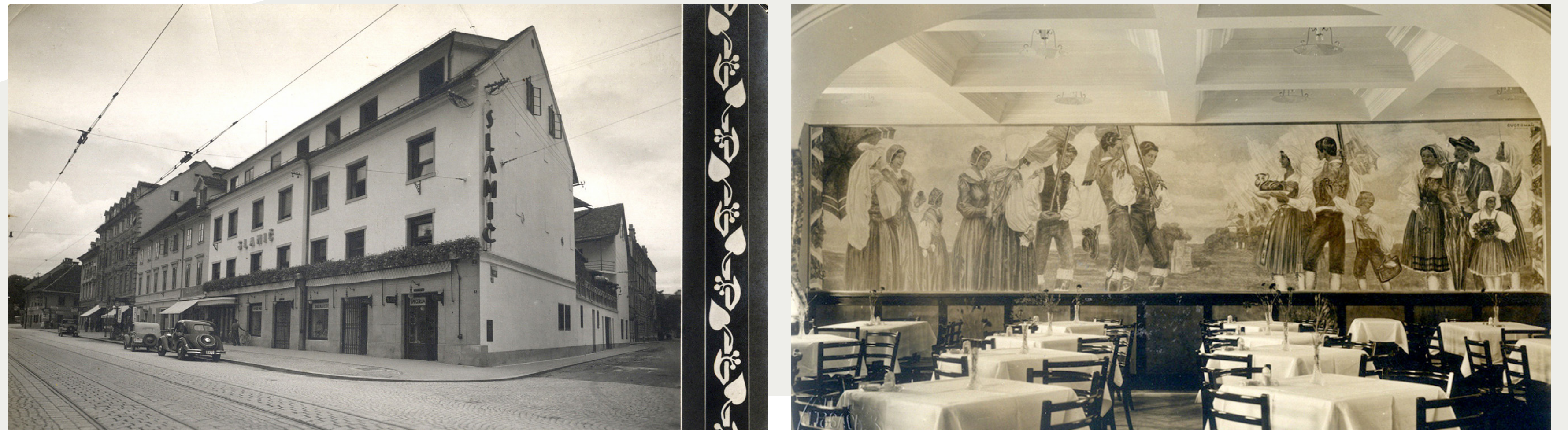
Slika 1, 2: Gostilna Slamič / Interior s poslikavo Kavarne in gostilne so imele pomembno vlogo pri družabnem življenju. Tja so zahajali tudi umetniki, politiki in drugi, ki so imeli svoja priljubljena zbirališča in omizja, tudi odvisno od politične in nacionalne usmeritve. Slamič je veljala kot dobra in priljubljena restavracija.