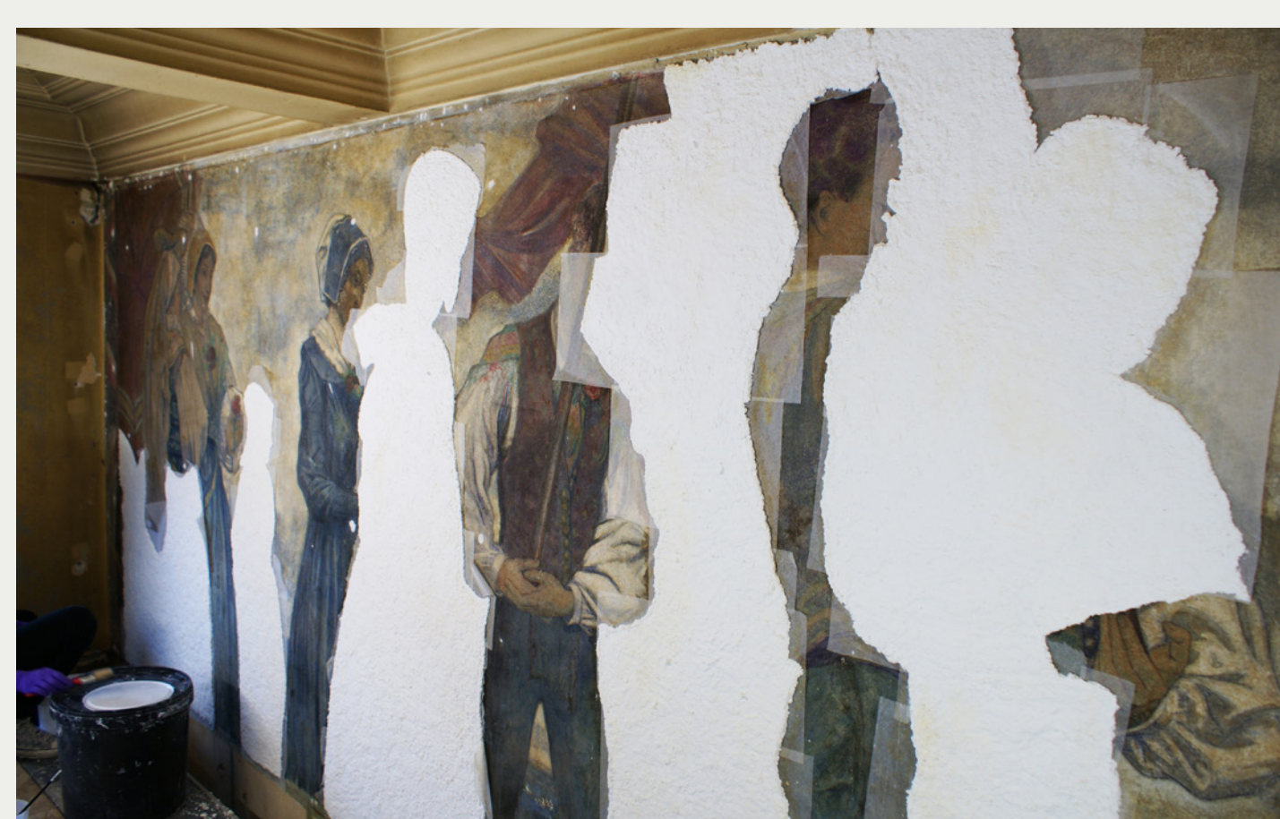
Slike 8-10: Del poslikave med čiščenjem s celuloznimi oblogami ter detalj pred in po odstranitvi nečistoč.

V obdobju med obema vojnama je narodna noša postala preobleka za prav posebne priložnosti in njen videz vedno bolj uniformiran. Etnolog Bojan Knific pravi, da je bil odnos do narodne noše romantično nostalgičen, saj je spremenila funkcijo in postala kostum, katerega namen je bil kazati posebnosti oblačilne dediščine naroda.