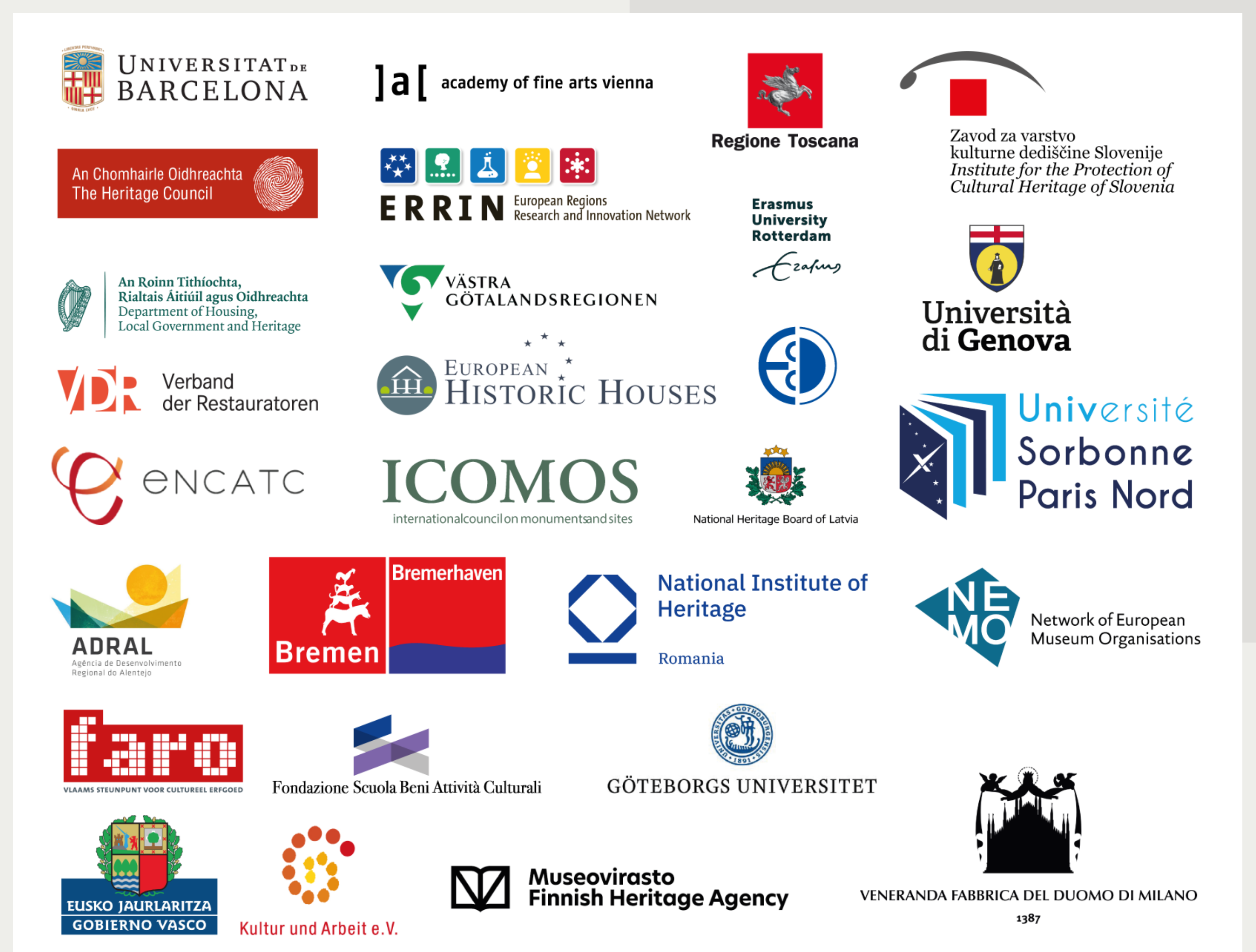
Slika 2: Partnerji CHARTERja.