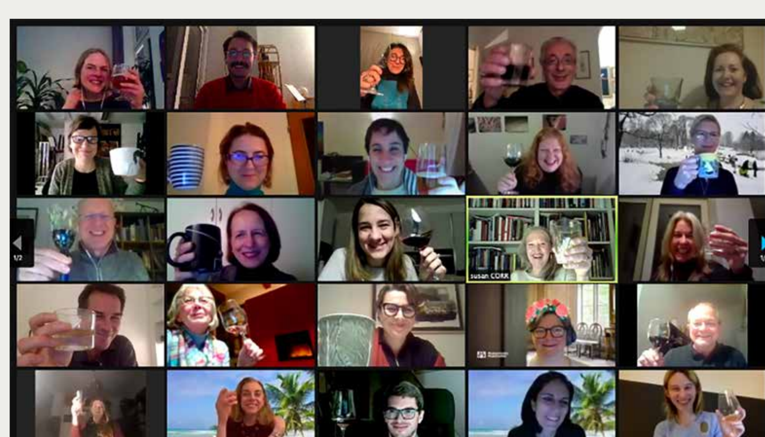
Slika 4: Srečanje predstavnikov partnerjev prek videokonferenčne platforme Zoom.