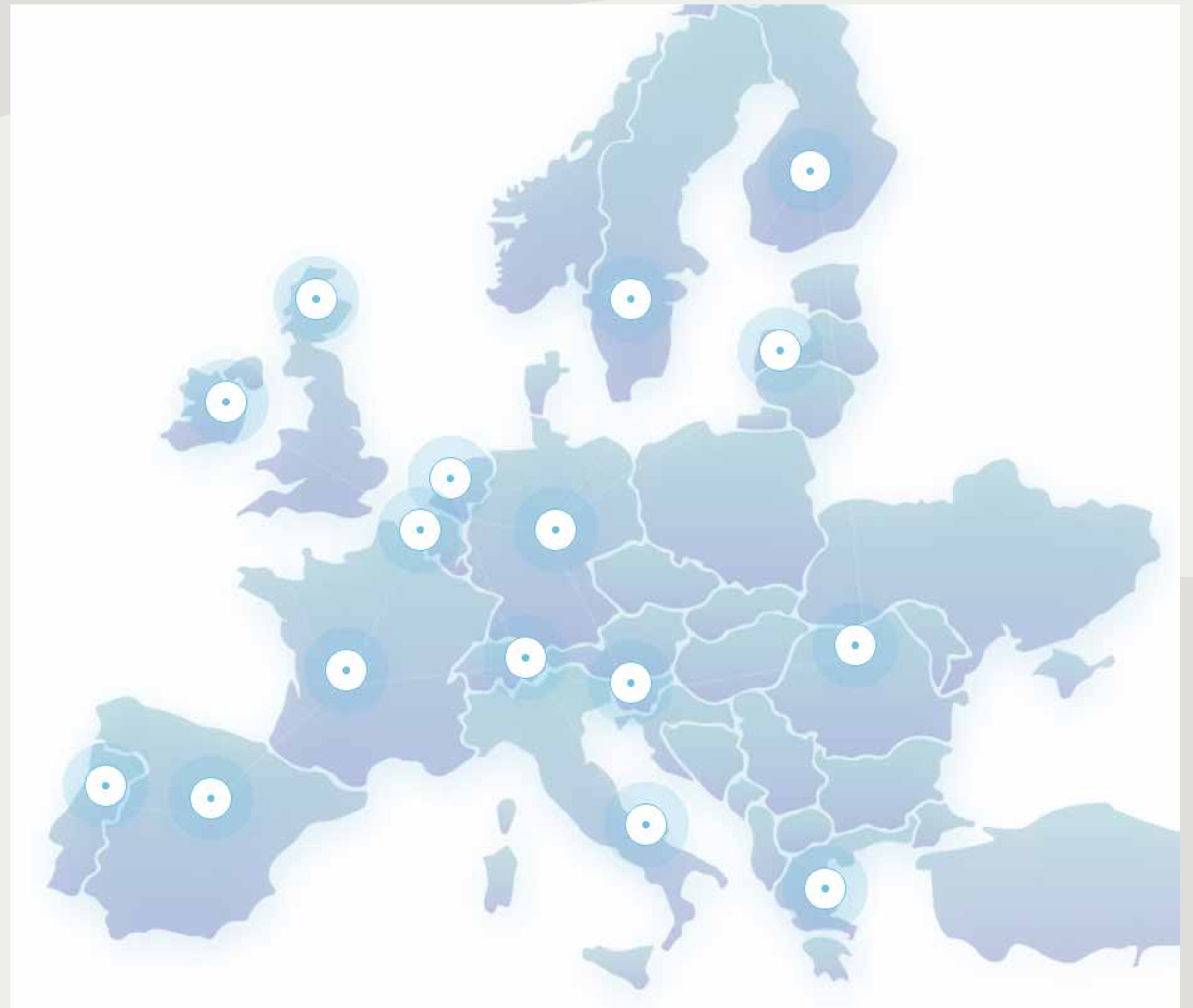
Slika 1: Zemljevid evropskih držav vključenih v projekt CHARTER.

CHARTER bo v Evropi zgradil trajno zavezništvo veščin kulturne dediščine z vključevanjem metodologij, rezultatov projekta, povečanjem in ustvarjanjem multiplikacijskih učinkov na regionalni, nacionalni in evropski ravni z namenom trajnega varovanja, spodbujanja in krepitve snovne in nesnovne dediščine.