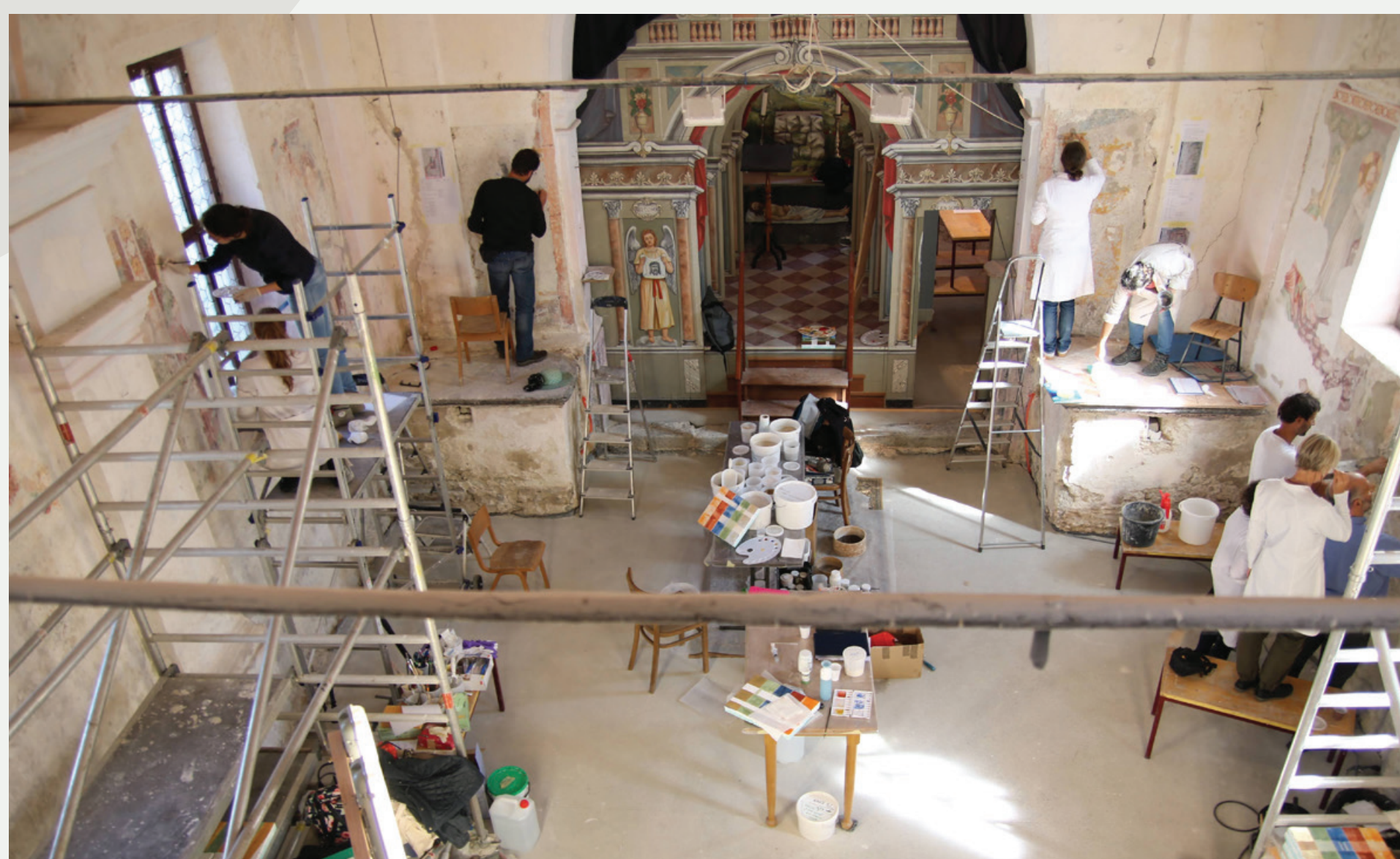
Sliki 1,2: Udeleženci delavnice med delom na poslikavah