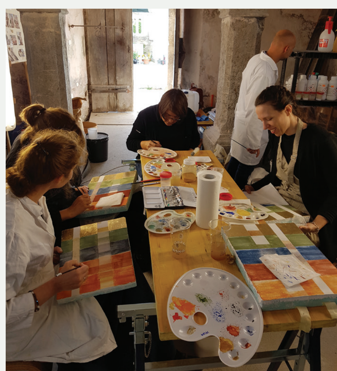
Slika 3: Udeleženci med izvedbo retuše na vajenih - barvna selekcija in barvna abstrakcija