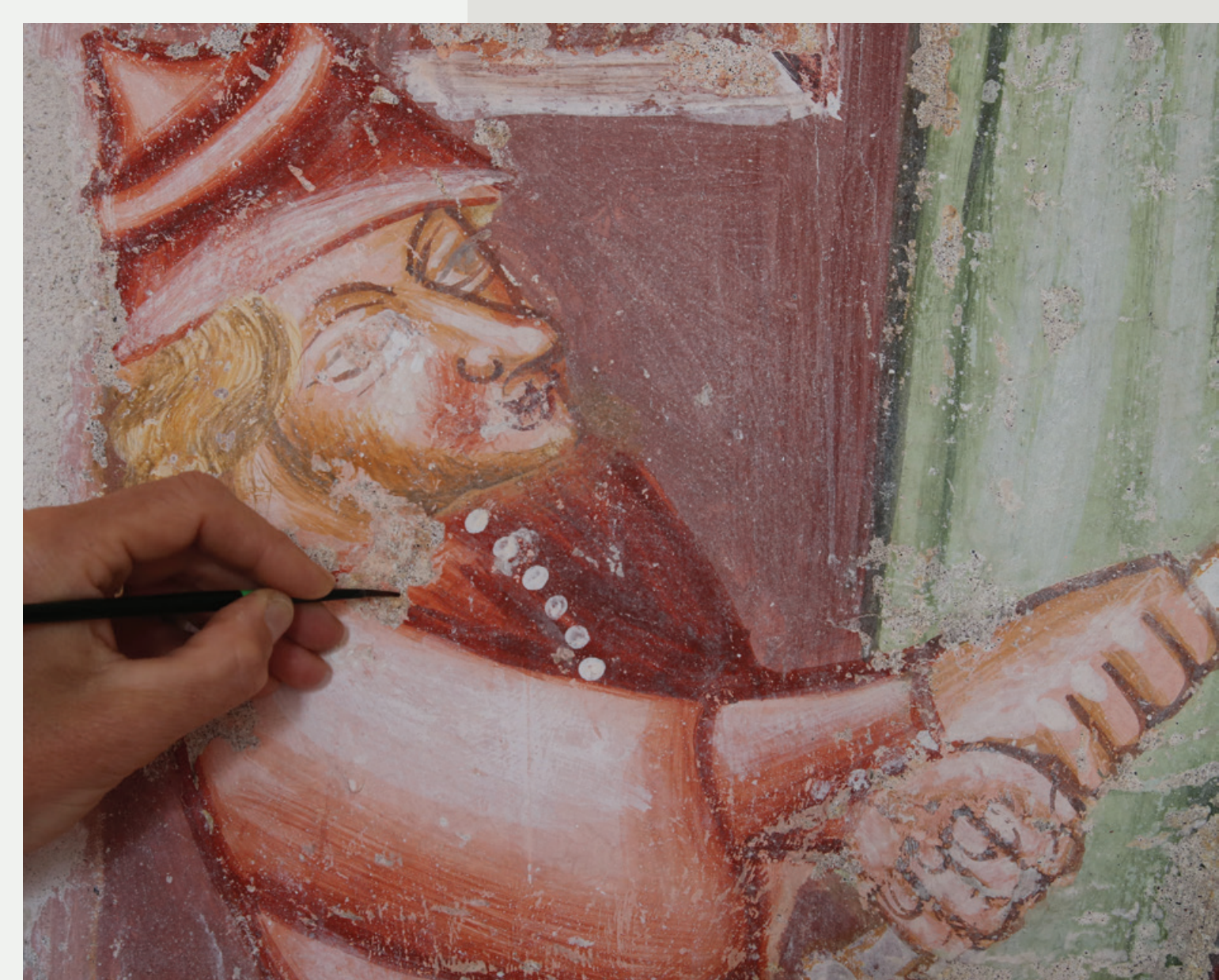
Slika 5: Izvedba podložne retuše