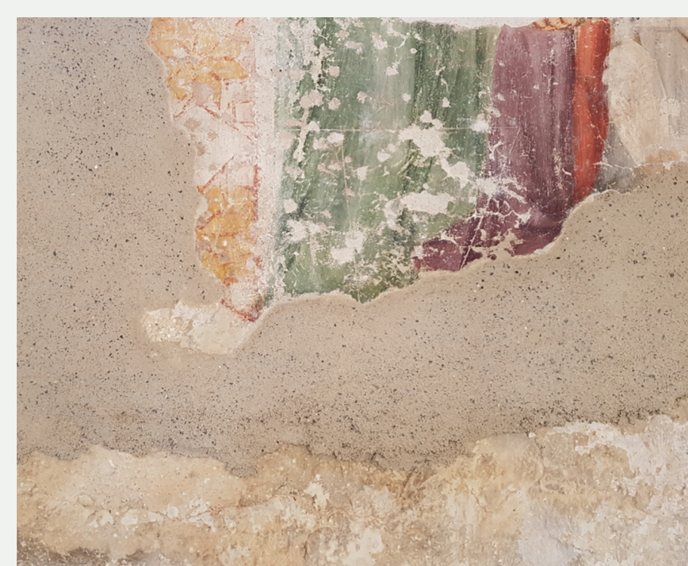
Slika 8: Poskusni nanos ometa ob poslikavi.