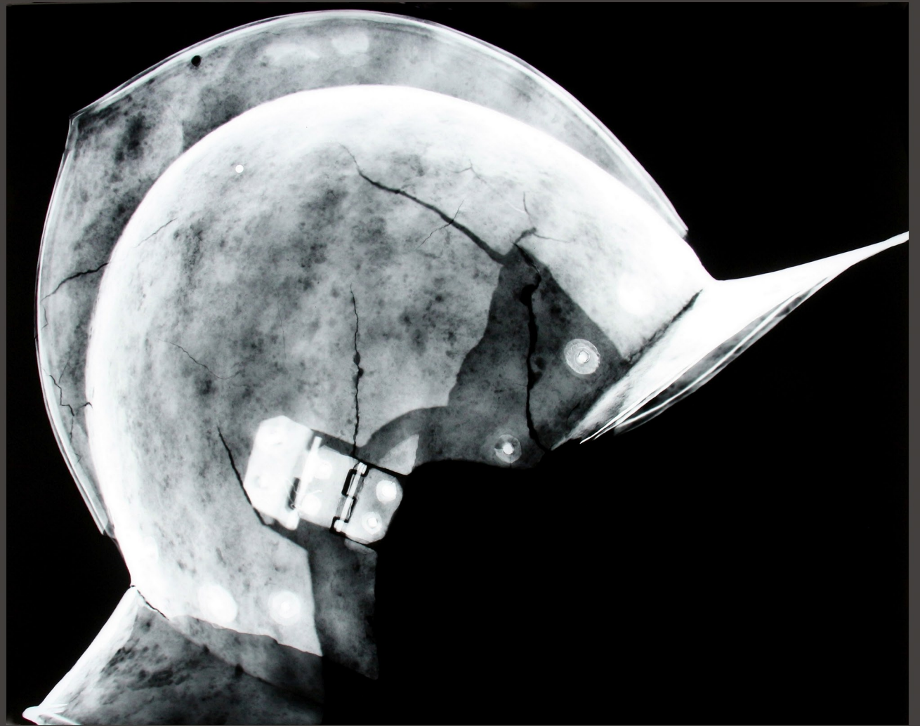
Rentgenski posnetek jurišne avbe

Restavriranje je potekalo po utečenih postopkih za železne predmete. Korozijske produkte smo odstranili s peskanjem z aluminijevim oksidom in steklenimi kroglicami. Sledili so nanašanje raztopine tanina, sušenje v sušilniku, ščetkanje z jekleno ščetko in lakiranje s čopičem s 5-odstotno raztopino Paraloida B 72. Odlomljeni del smo na prvotno mesto pritrčili s pomočjo tkanine iz steklenih vlaken in 15-odstotne raztopine Paraloida B 72. Na koncu smo avbo zaščitili še z mikrokristaliničnim voskom.