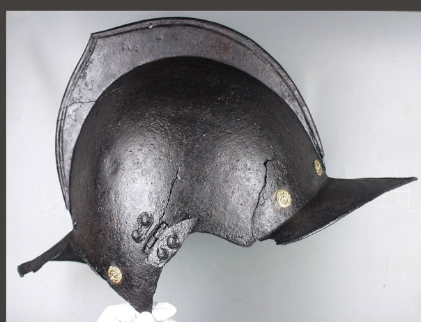
Površina po nanosu tanina in podlaganje s steklenimi vlakni