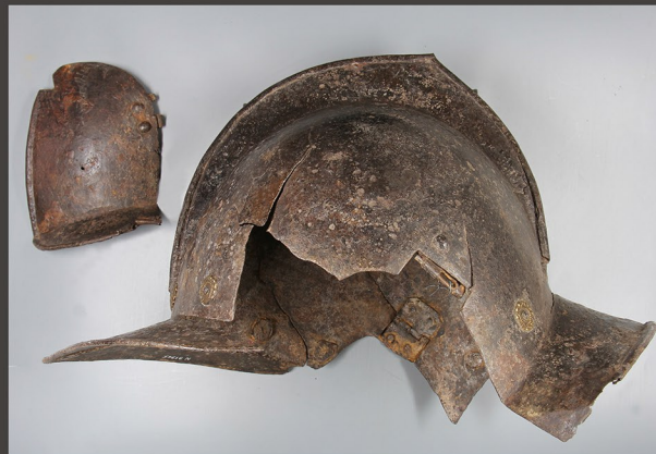
Stanje pred posegi