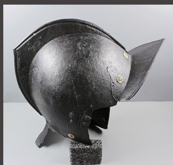
Jurišna avba po končanih posegih