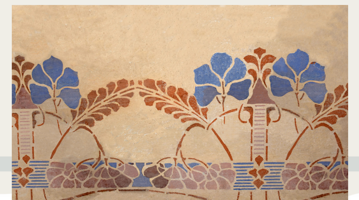
Grafični rekonstrukciji poslikav iz hiše Begunje pri Cerknici 37.