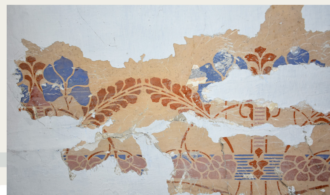
Sondi delno odkritih poslikav iz hiše Begunje pri Cerknici 37.