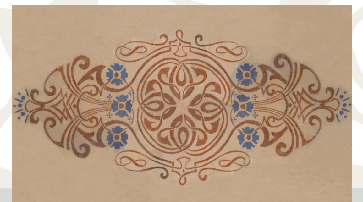
Grafična rekonstrukcija poslikave iz hiše Selšček 31.