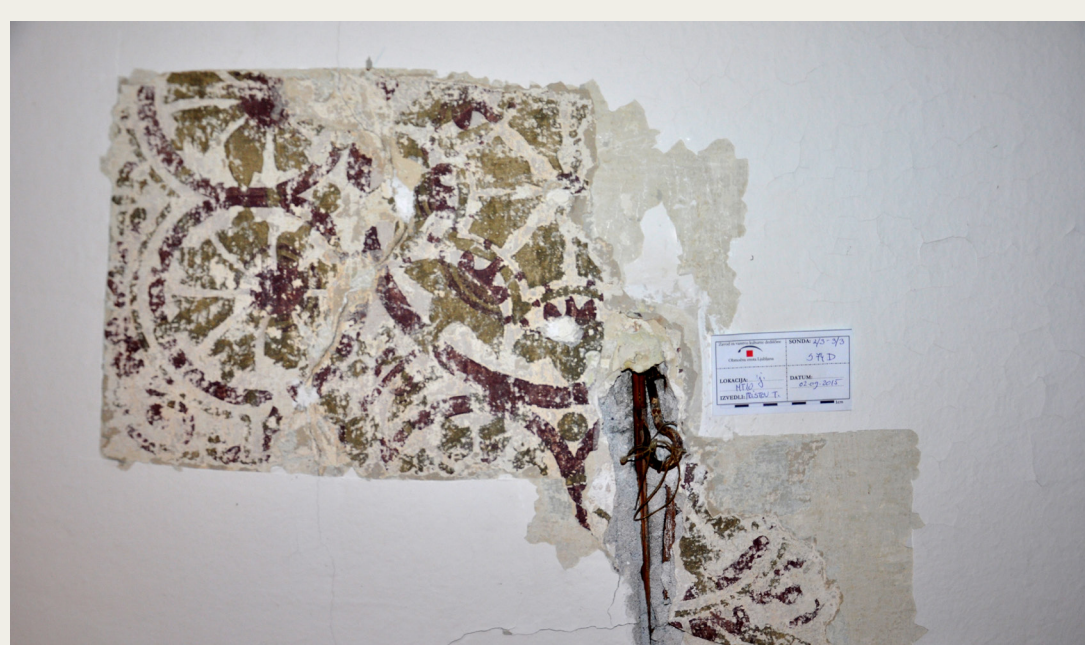
Sonda delno odkrite poslikave iz hiše Mestni trg 10.