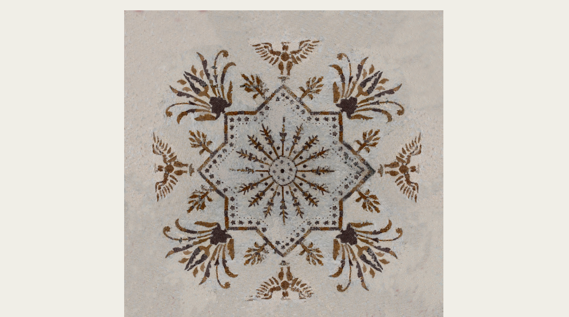
Grafična rekonstrukcija poslikave iz hiše Selšček 31.

V primeru palače Kolizej ali vile Madelaine v Ljubljani je originalno materialno in dokumentarno gradivo žal povsem izgubljeno. V nedavnih primerih rušitve hiš Begunje pri Cerknici 37 in Hotavlje 33, nam je kljub slabemu stanju uspelo temeljiteje dokumentirati vsaj delček ohranjenih dekorativnih poslikav. Predhodne raziskave, izvedene v sklopu celostnih prenov ljubljanskih meščanskih hiš na Čevljarški 2, Študentovski 7 in Mestnem trgu 10, so razkrile bogat in raznovrsten nabor poslikav iz različnih časovnih obdobij. Dekorativne poslikave, ki so si v več plasteh sledile ena za drugo, so nakazale na problem žrtvovanega sloja ob odkrivanju in še bolj poudarile pomen temeljitega dokumentiranja vsake plasti posebej. Žal tudi v teh primerih ni bilo mogoče ohraniti originalnih poslikanih površin v celoti in jih vsaj delno prezentirati.