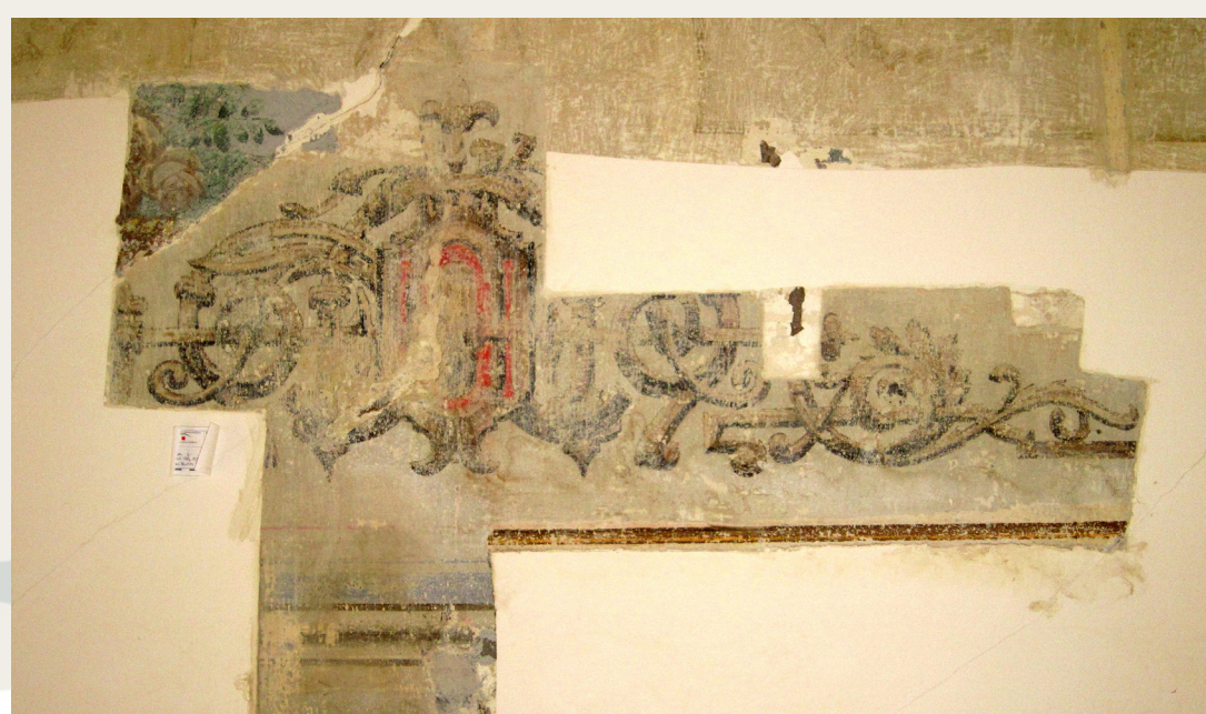
Sonda delno odkritih poslikav iz hiše Mestni trg 10.

Prvi pogoj za uspešno obravnavo so jasno zasnovani in argumentirani kulturnovarstveni pogoji ter smernice za prenavo, ki temeljijo na pravnih režimih varstva kulturne dediščine. S tem so vsaj teoretično zagotovljeni osnovni pogoji za izvedbo ustreznih raziskav in omogočajo vključitev morebitnih najdb v obnovo. Nemalokrat se kljub strokovnemu pristopu zgodi, da je raziskovalno delo onemogočeno. Stavbe, ki so bile zaradi zanemarjanja, neurejenih lastninskih pravic ali pomanjkanja sredstev za vzdrževalna dela več let prepuščene propadanju, so končale v tako slabem stanju, da je bilo izdano dovoljenje za njihovo porušitev. Zaradi zagotavljanja varnosti predhodne raziskave niso bile več mogoče.