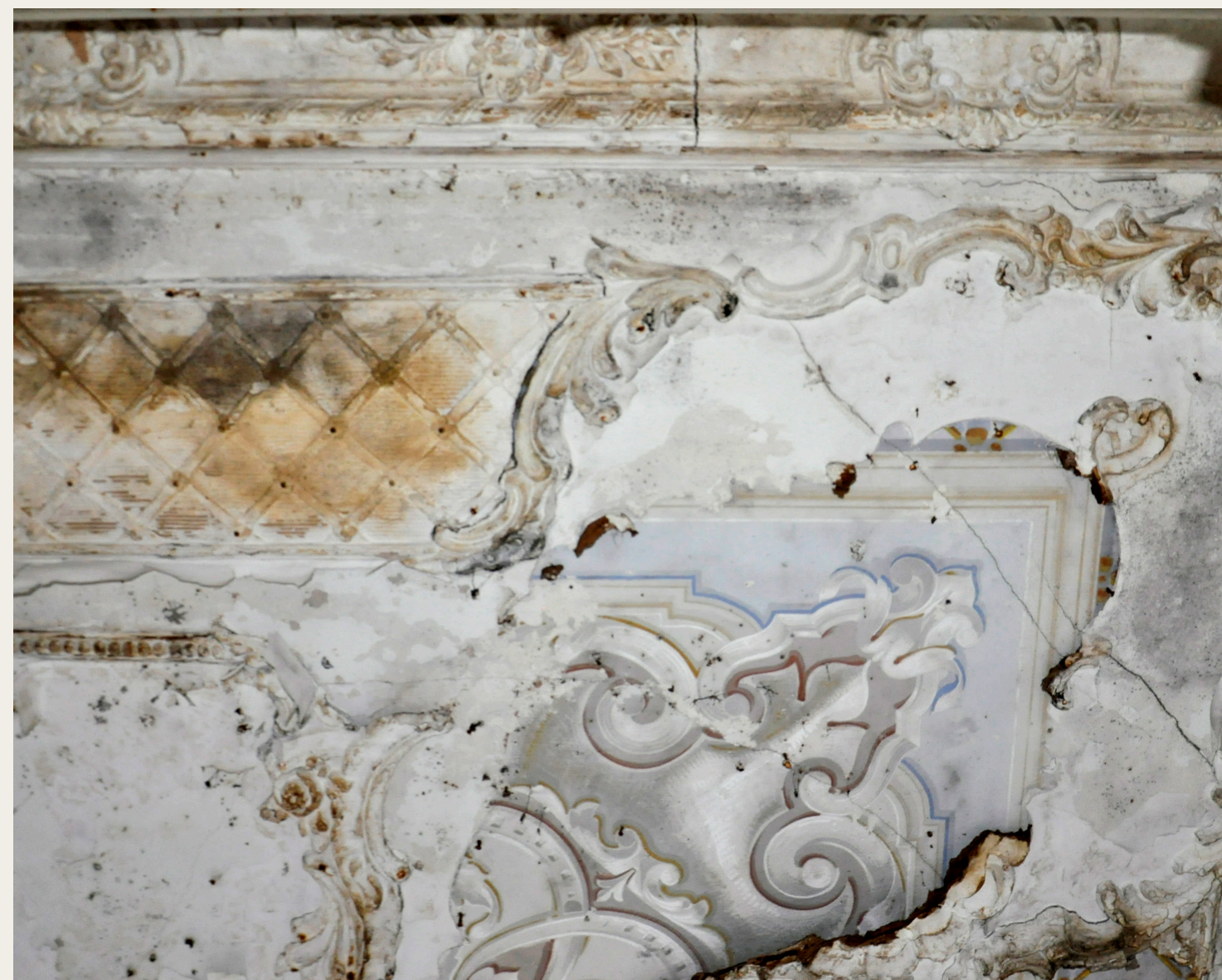
Dekorativen strop iz vile Madelaine.

V javnosti se najpogosteje predstavljajo uspešno izvedeni konservatorsko restavratorski projekti na izredno visokem strokovnem nivoju. Vedno večja angažiranost je usmerjena tudi v reševanje dekorativnih stenskih poslikav, vendar so te ne glede na prizadevanja zaradi različnih razlogov žal pogosto uničene, njihova originalna substanca pa izgubljena. Tema je v času pospešenega izvajanja večjih stavbnih prenov aktualna, celoten proces ohranjanja in prezentiranja stenskih poslikav pa spremlja sorodna problematika.