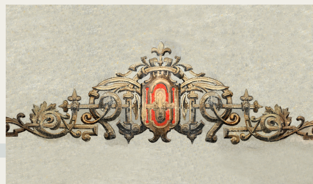
Grafični rekonstrukciji poslikav iz hiše na Mestnem trgu 10.