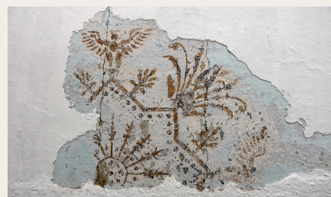
Sonda delno odkrite poslikave iz hiše Selšček 31.