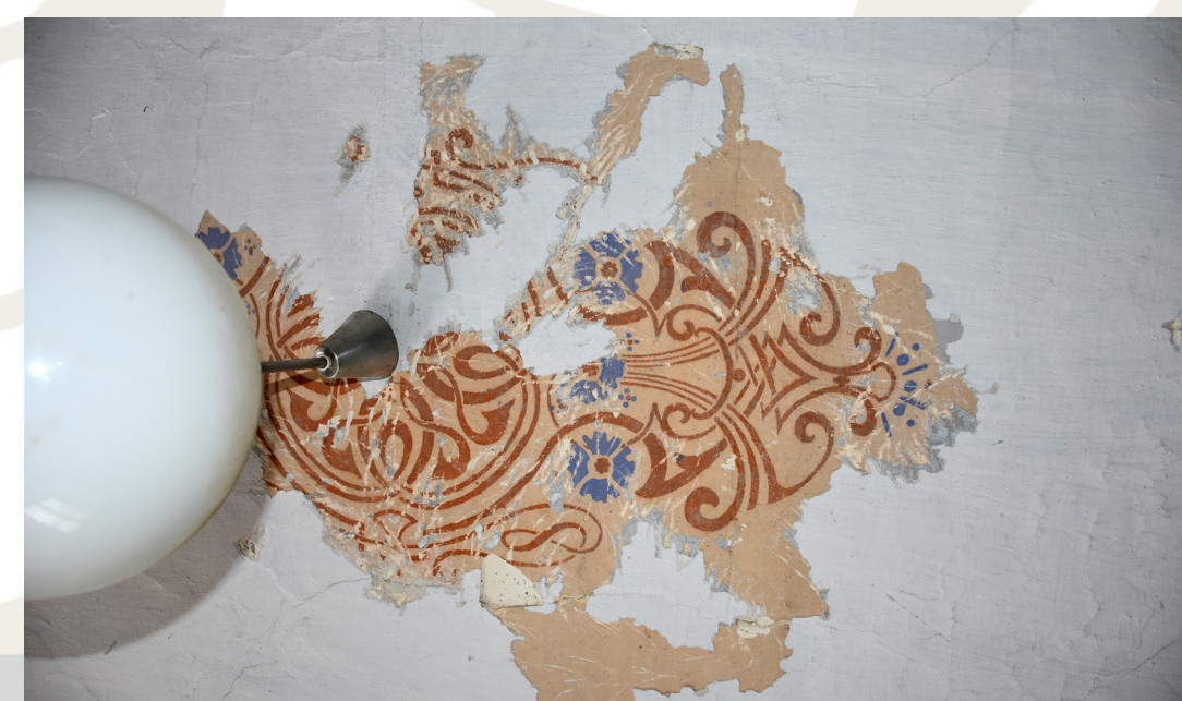
Sonda delno odkrite poslikave iz hiše Selšček 31.