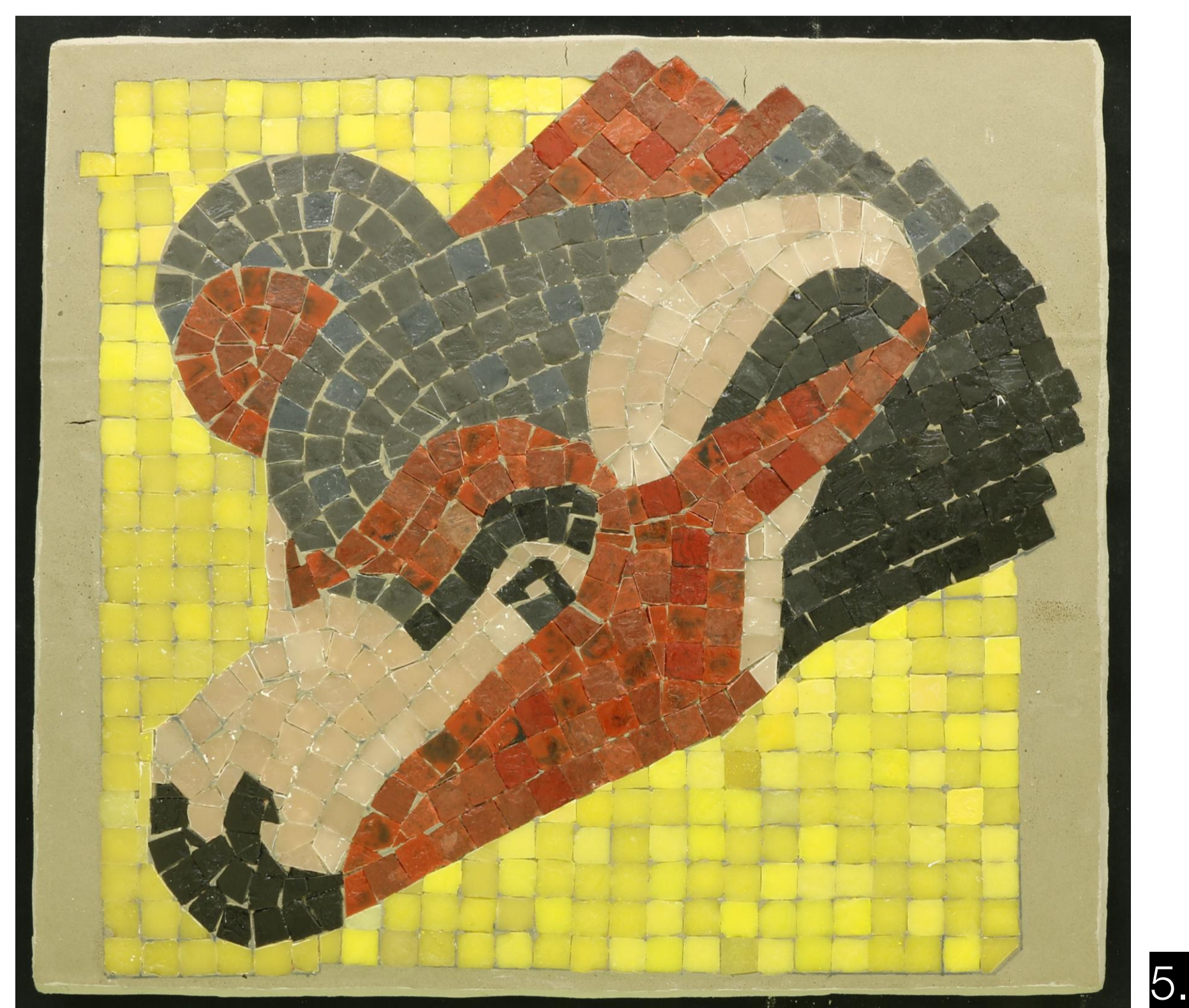
Slika 1: Kosa mozaika iz Mestne hranilnice ljubljanske Slika 2: Grafični prikaz poškodb Slika 3: Izdelava kalupa za ulivanje novih ploščic Slika 4: Izdelava kopije mozaika Slika 5: Končana kopija detajla mozaika