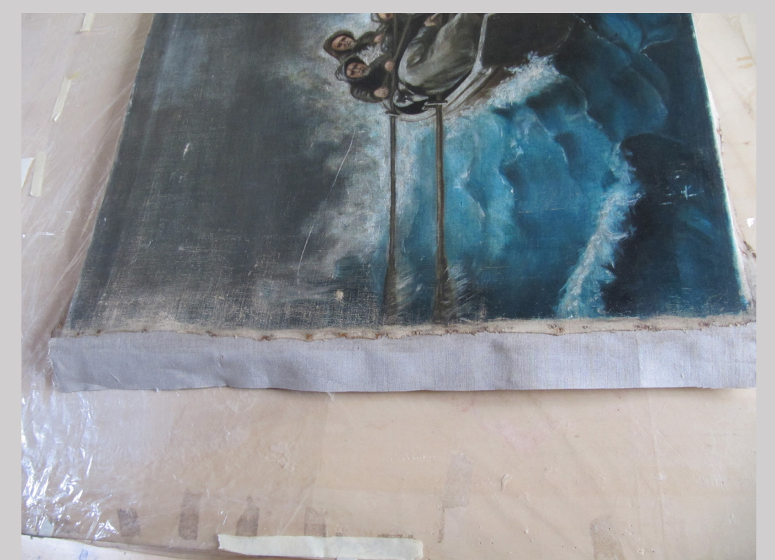
Slika 6 xxx