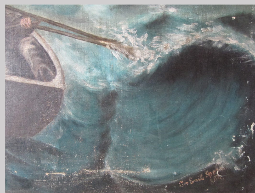
Slika 9 xxxx