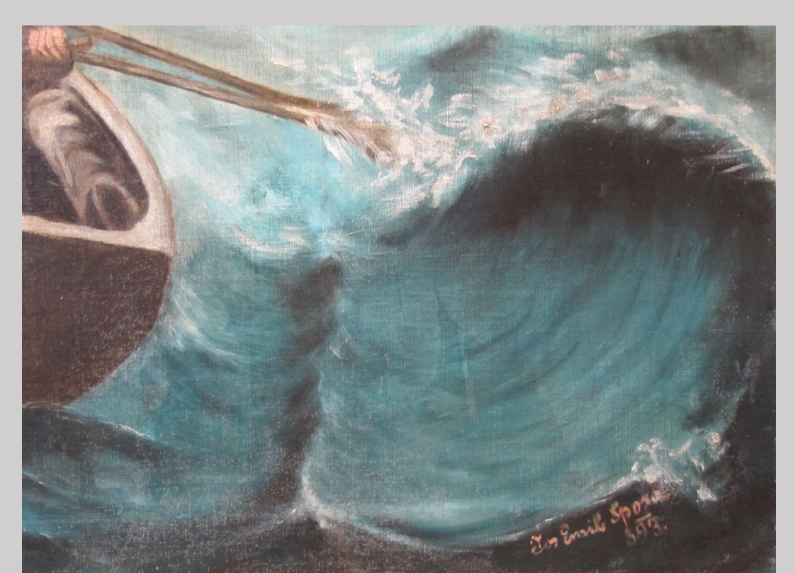
Slika 10 xxxx