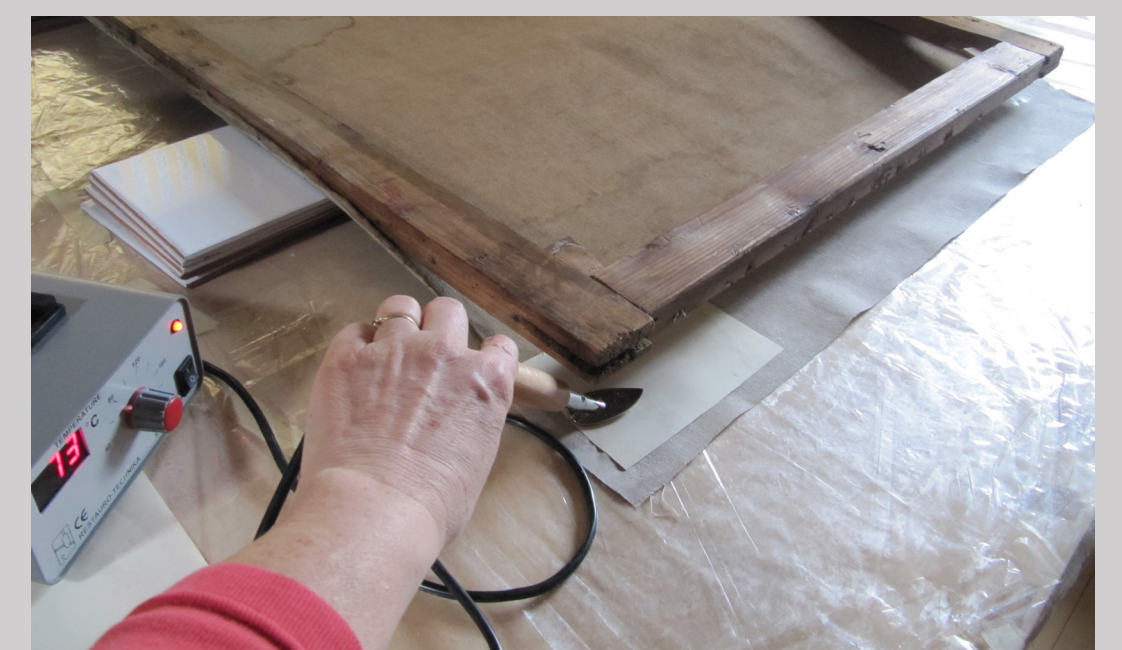
Slika 4 xxx