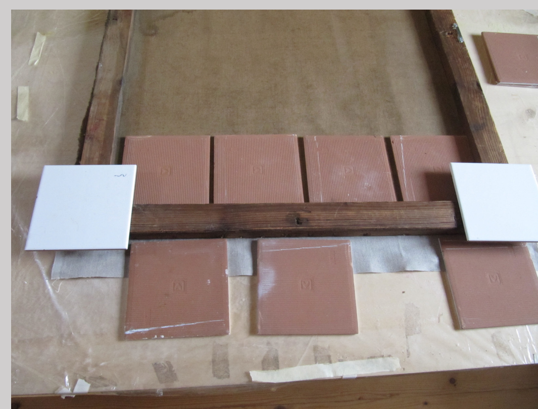
Slika 5 xxx