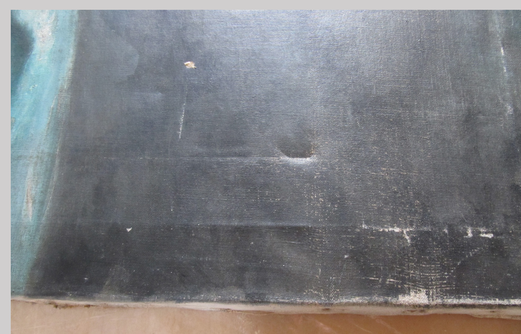
Slika 7 xxx