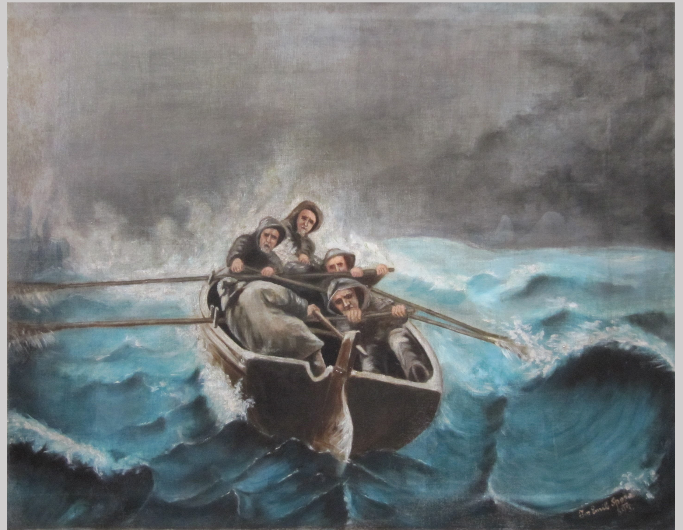
Slika 3 Stanje po posegih

Poškodbe sem zakitala s kredno-klejnim kitom in jih izolirala s raztopino šelaka. Sliko sem lakirala z damarjevim lakom. Retuše poškodb sem opravila z barvami Maimeri® Restauro in oljnimi barvami.