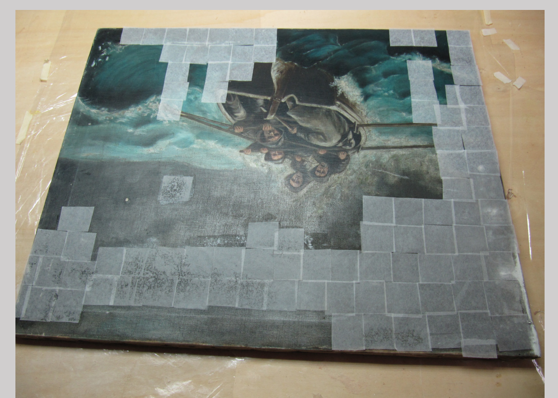
Slika 8 xxxxx