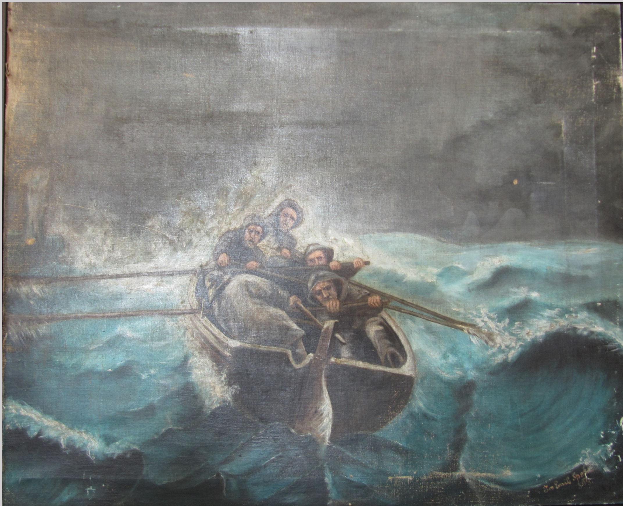
Slika 1 Stanje pred posegi

Slika iz zasebne zbirke ima podpis avtorja: Jos Emil Spora, - 893, naslikane v oljni tehniki in je velikosti 92 x 75cm. Ob prevzemu slike v restavriranje je lastnik izrazil željo, da se popravijo le najbolj vidne poškodbe, ki so nastale ob nepravilnem ravnanju ali hranjenju slike, kot so udrtine platna, odrgnine barvne plasti in pretrganine.