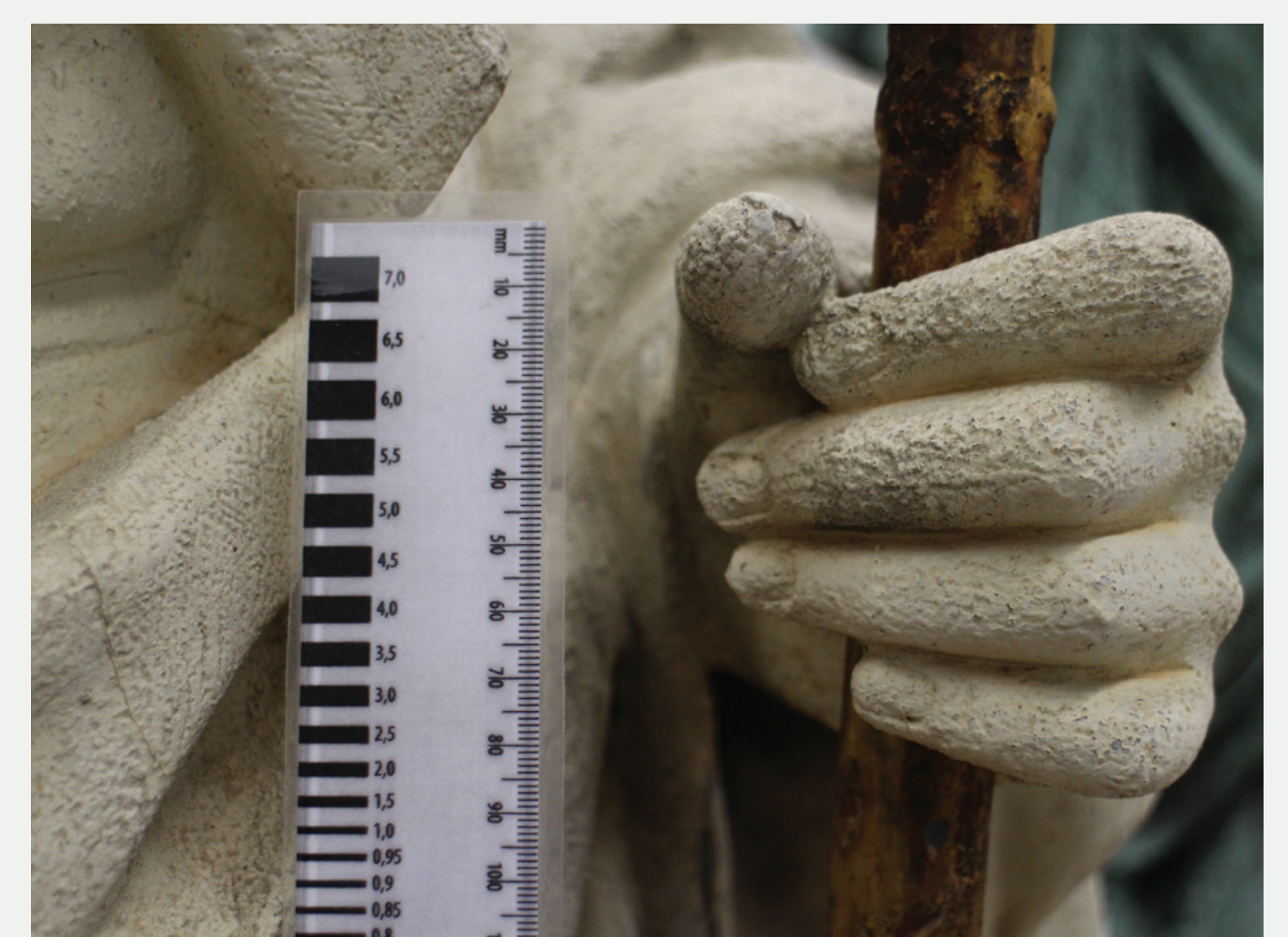
Slika 5 Dokumentacija stanja demontirane figuralike, detajl figure sv. Jakoba.