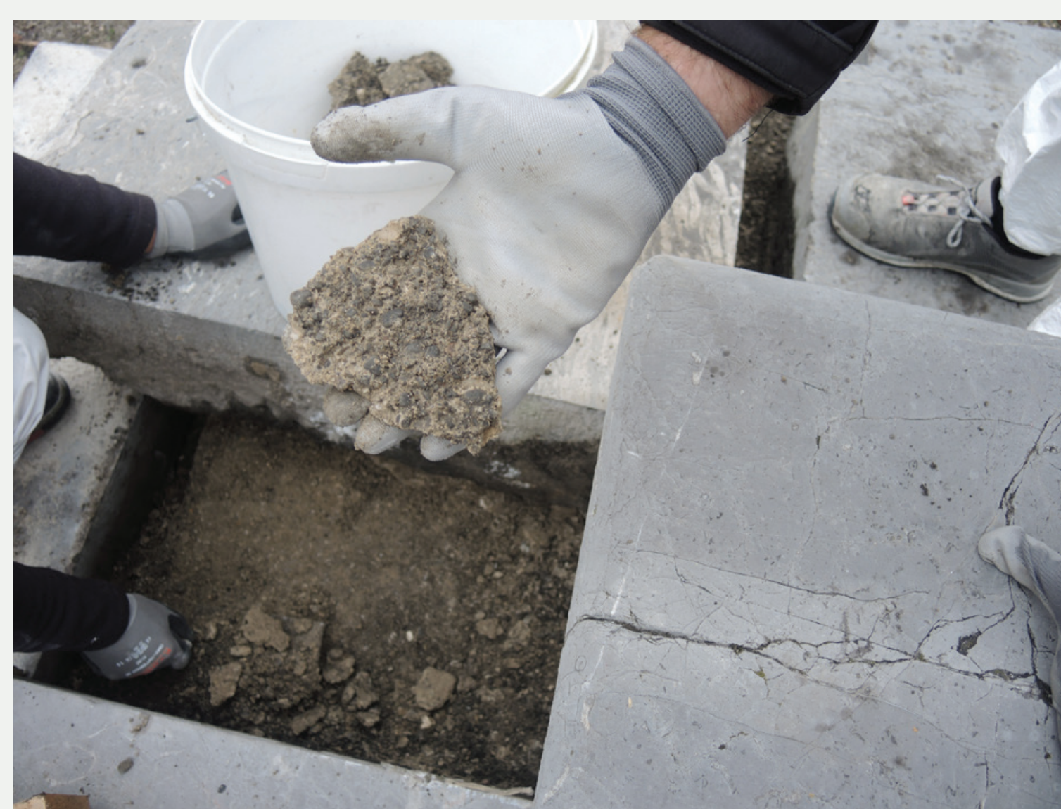
Slika 4 Sondažne raziskave na stopničastem podstavku spomenika.