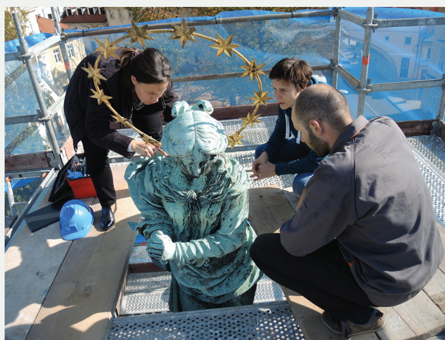
Slika 2 Ocenjevanje stanja figure Brezmadežne.