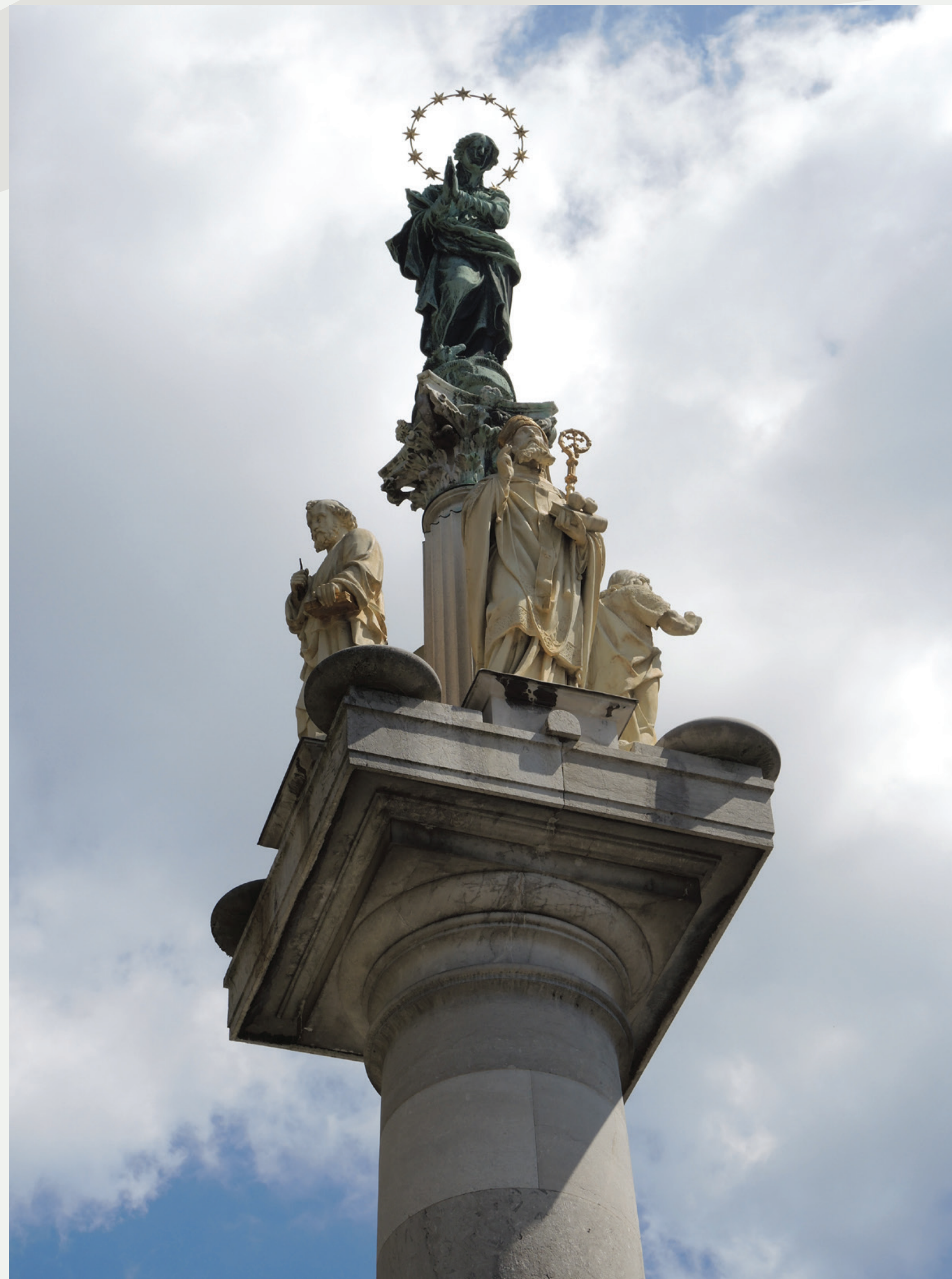
Slika 1 Vrh Marijinega stebra s figuralno kompozicijo pred demontažo.

Marijin steber, predvsem pa figura Brezmadežne kot osrednji element, je eden izmed najpomembnejših javnih spomenikov na Slovenskem, tako z umetniškega in zgodovinskega kakor tudi s tehnološkega vidika. Priprava predloga sanacije in načrtovanje posegov je zato kompleksna naloga, pri kateri je potrebno interdisciplinarno sodelovanje domačih in tujih strokovnjakov.