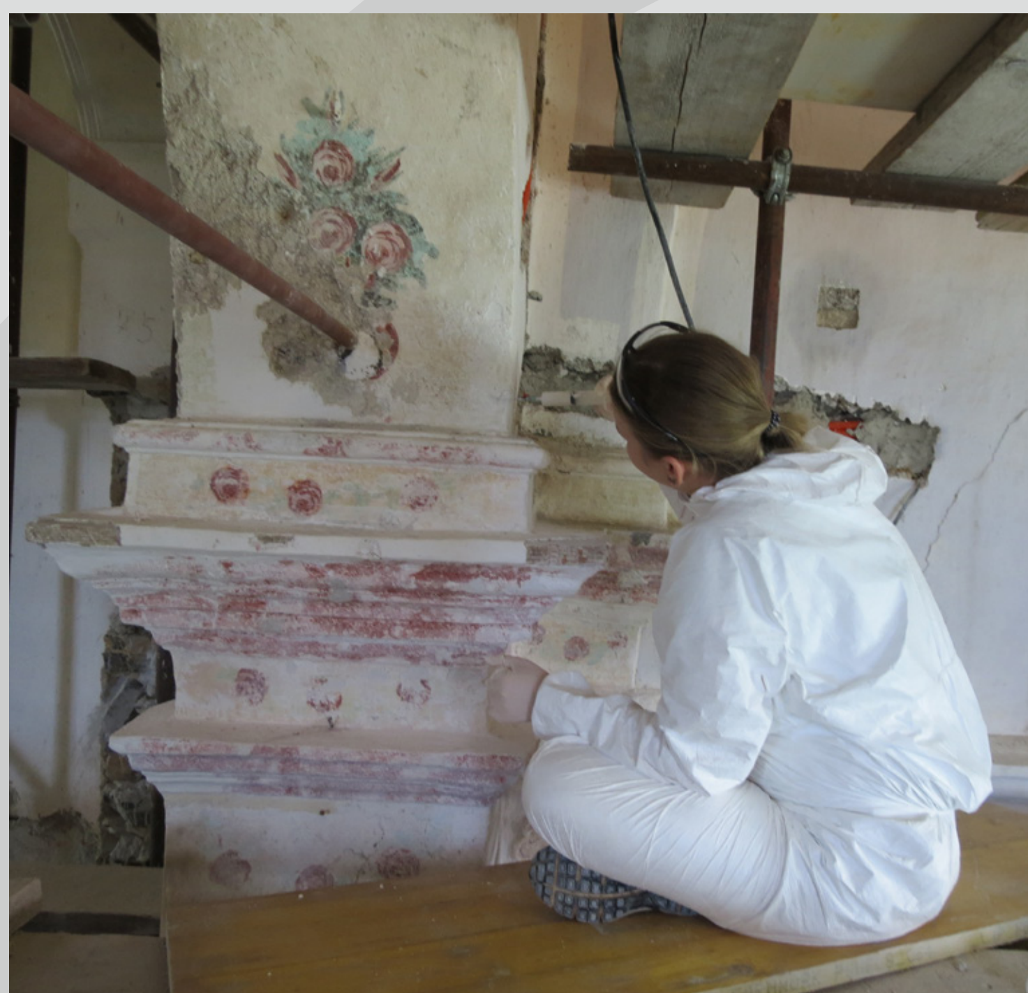
Slika 8: Med odkrivanjem dekorativne poslikave v prezbiteriju.