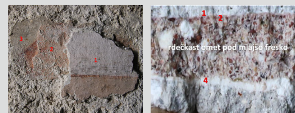
Slika 6: Tri plasti poslikav. Slika 7: Stratigrafija ometov in barvnih plasti.