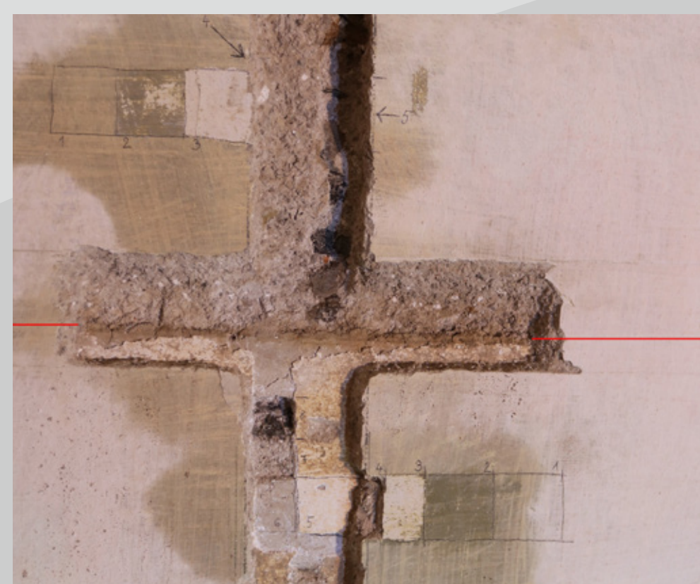
Slika 2: Sondiranje ometov in beležev.