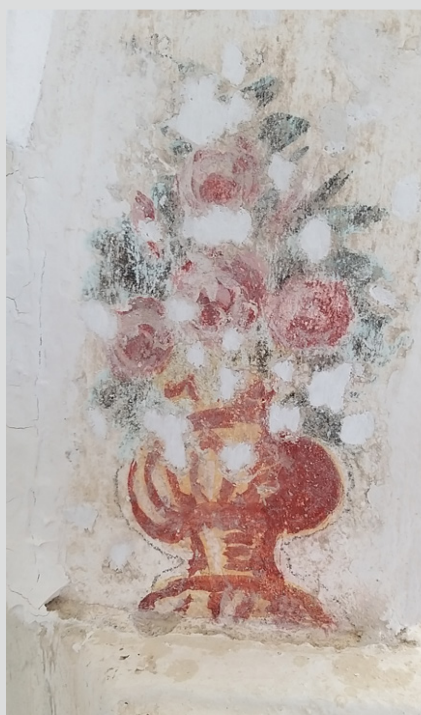
Slika 9: Del dekorativne poslikave med kitanjem.