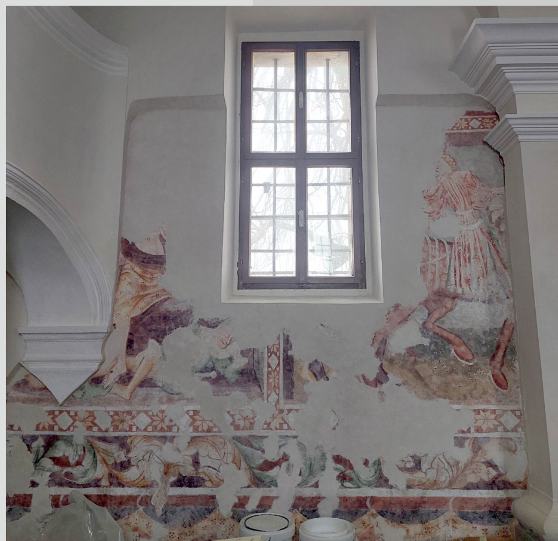
Slika 14: Odkrite gotske poslikave v ladji po izvedenih posegih.