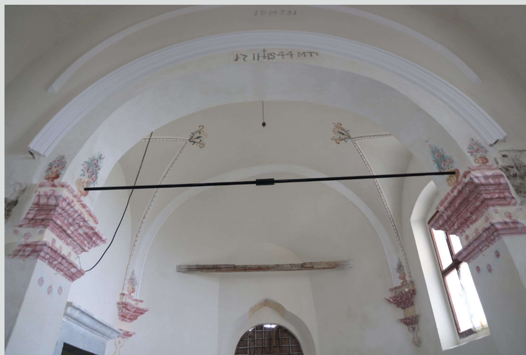
Slika 10: Prezbitirij po posegih in po beljenju.