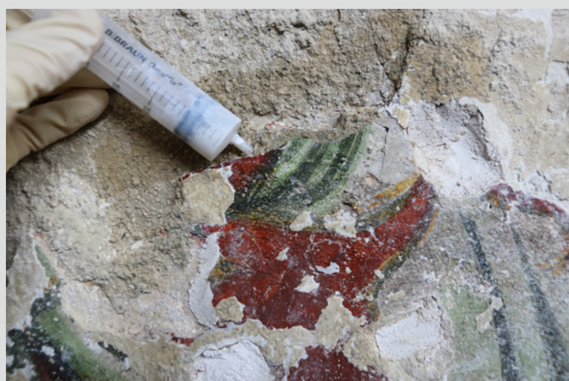
Slika 12: Injektiranje.