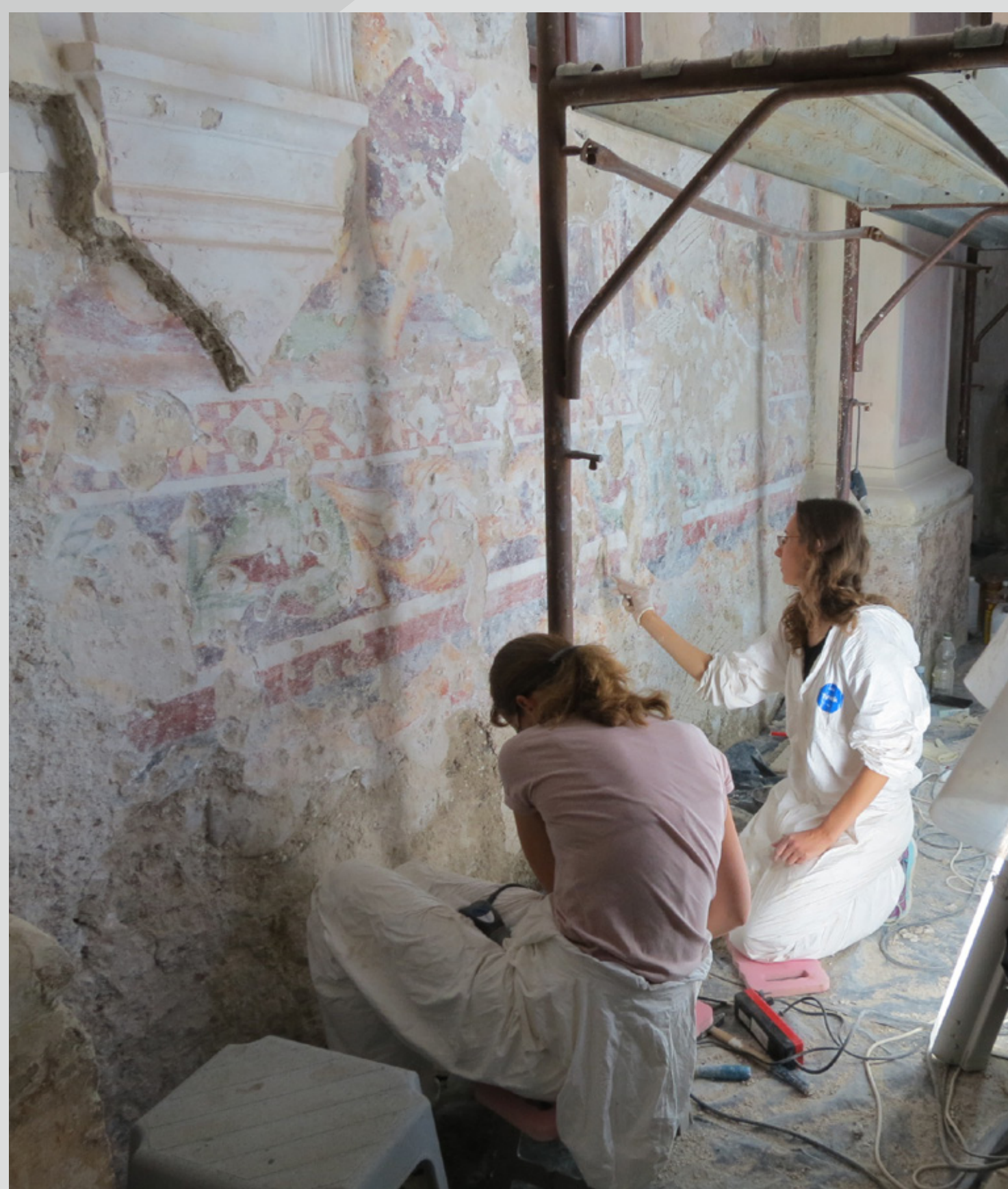
Slika 11: Med delom na odkritih gotskih poslikavah v prezbiteriju.