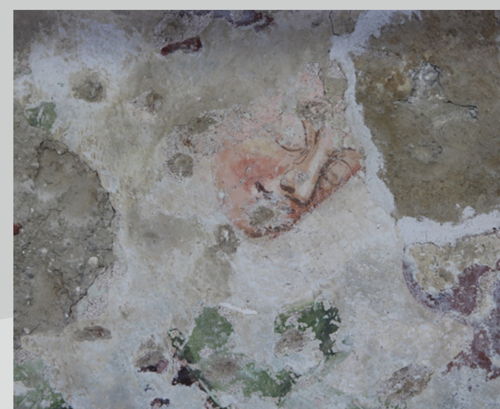
Slika 5: Del odkrite figuralne poslikave na severni steni ladje.