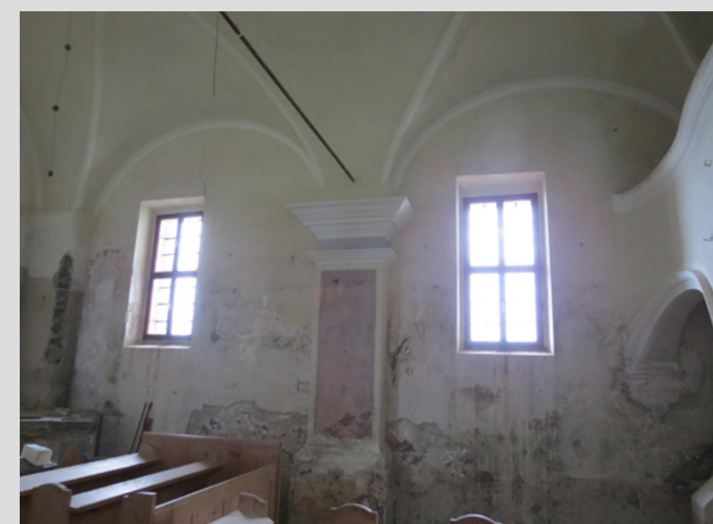
Slika 4: Severna stena ladje pred sondiranjem in pred posegi.