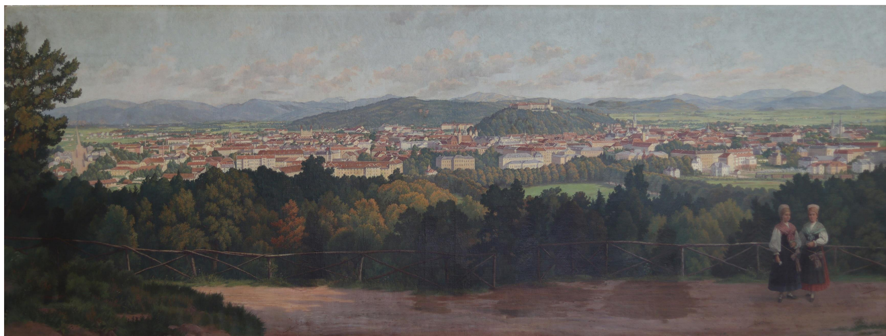
Slika 1: Slika v vidni svetlobi

Liza Lampič Konservatorsko središče ŠČIT