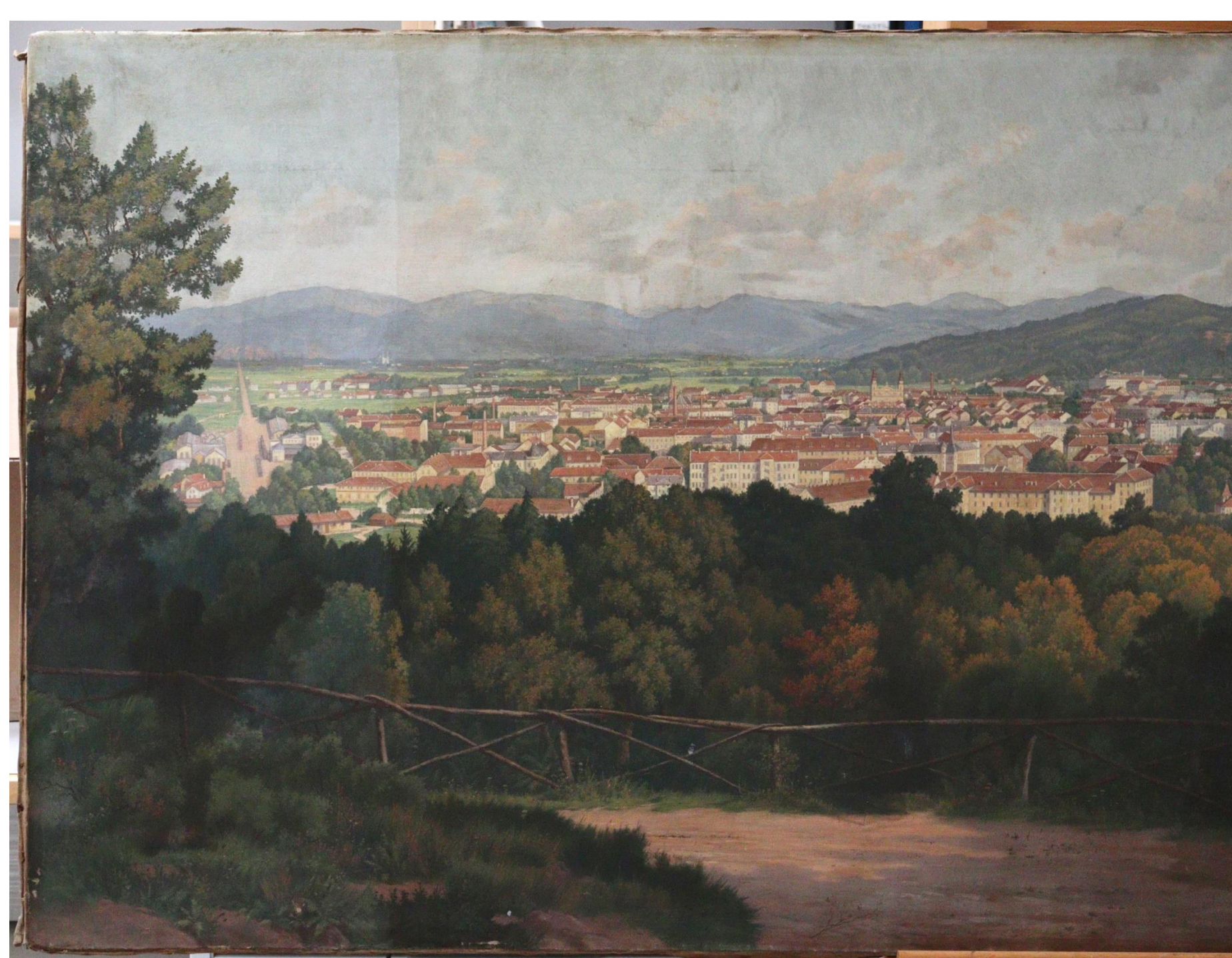
Slika 3: Figura na levi vidna po odstranitvi laka