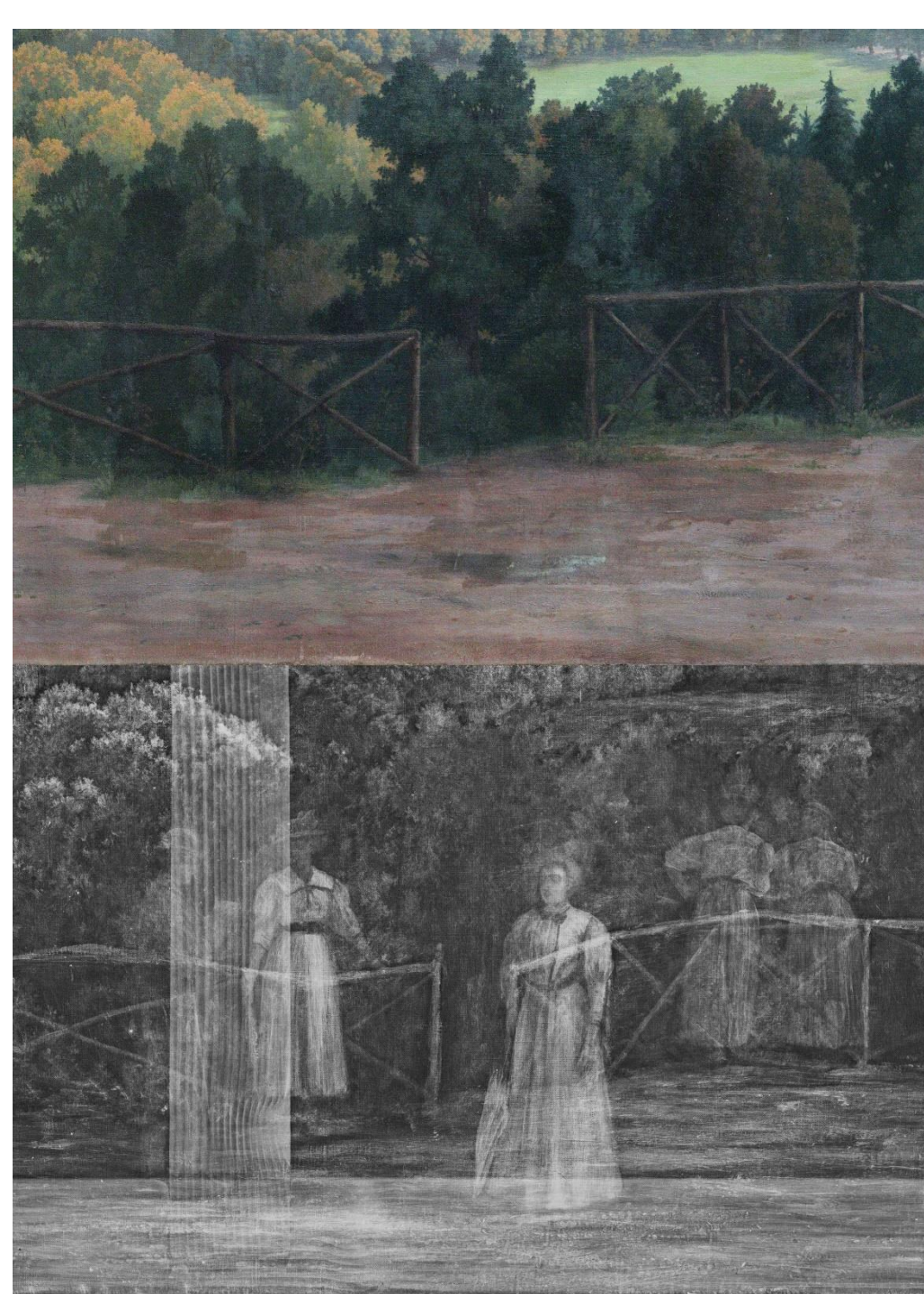
Slika 4: Detajl v VIS in rentgenski radiografiji

V Hribarjevi Vili Zlati, ki je bila po prenovi javnosti predstavljena maja 2021, je razstavljeno delo F. Wernerja Veduta Ljubljane z Rožnika. V ozadju prikazuje Ljubljano v začetku prejšnjega stoletja, v ospredju pa sprehajališče z ženskima figurama v narodnih nošah.