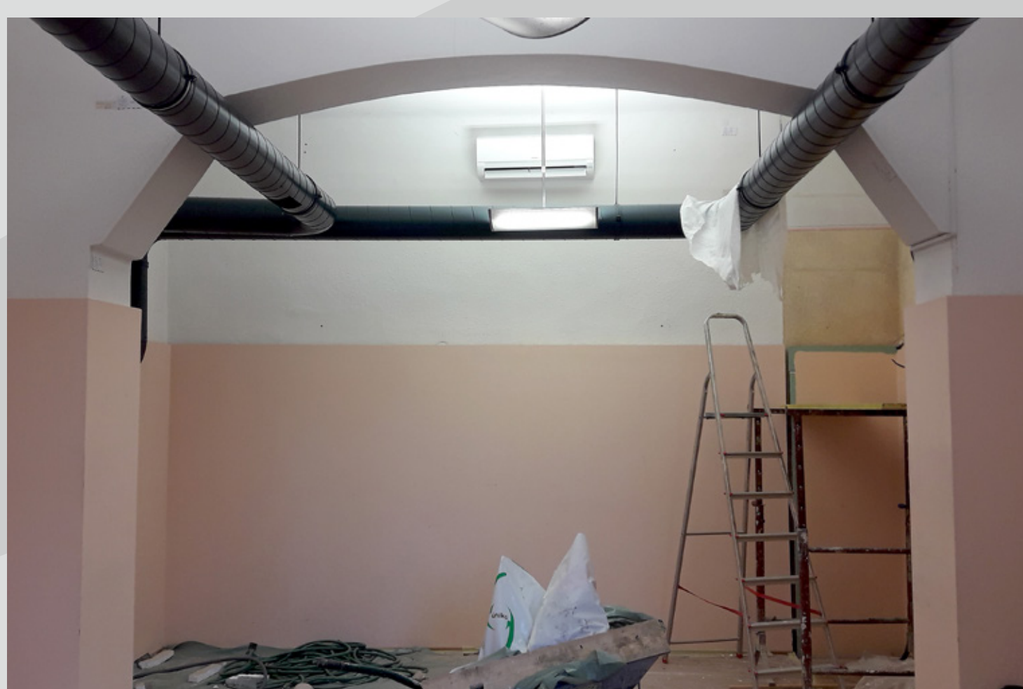
Slika 3: Pogled na dvodelni prostor nekdanje učilnice kot posledica kasnejših obnov notranjščine.