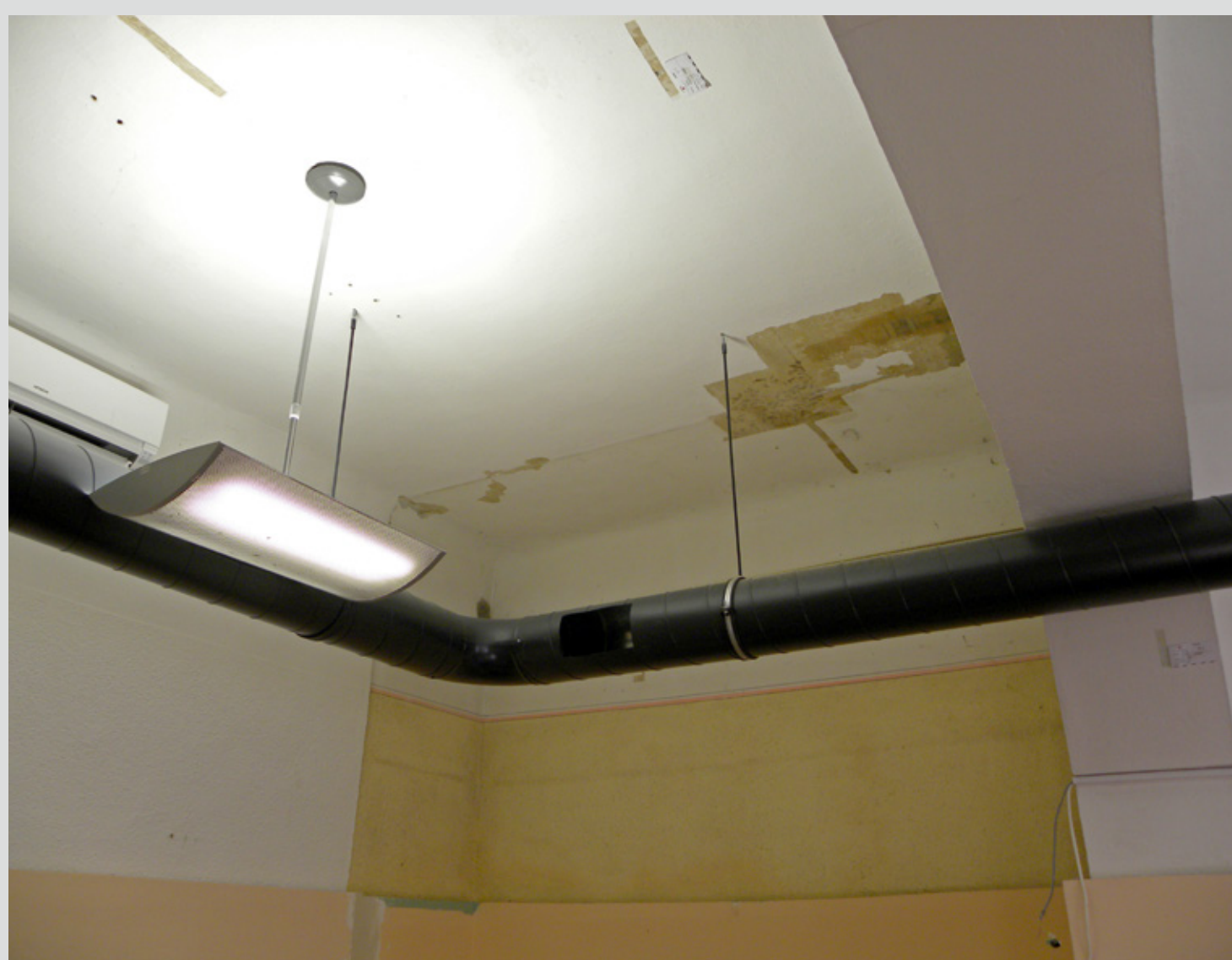
Slika 1: Pogled na lokacijo odstranjene vgradne omare, kjer se je odkrila stropna dekoracija.

Sodelavka: Maša Berdon, študentka restavracije ALUO.