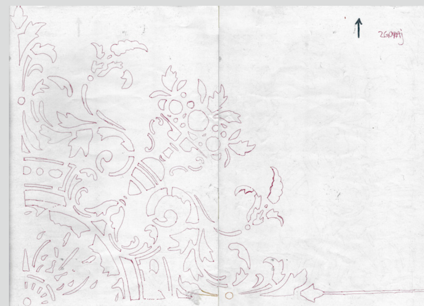
Slika 6: Skenogram izrisa šablonske dekoracije v vogalu, ki predstavlja četrtino rozete s premerom 80 cm.