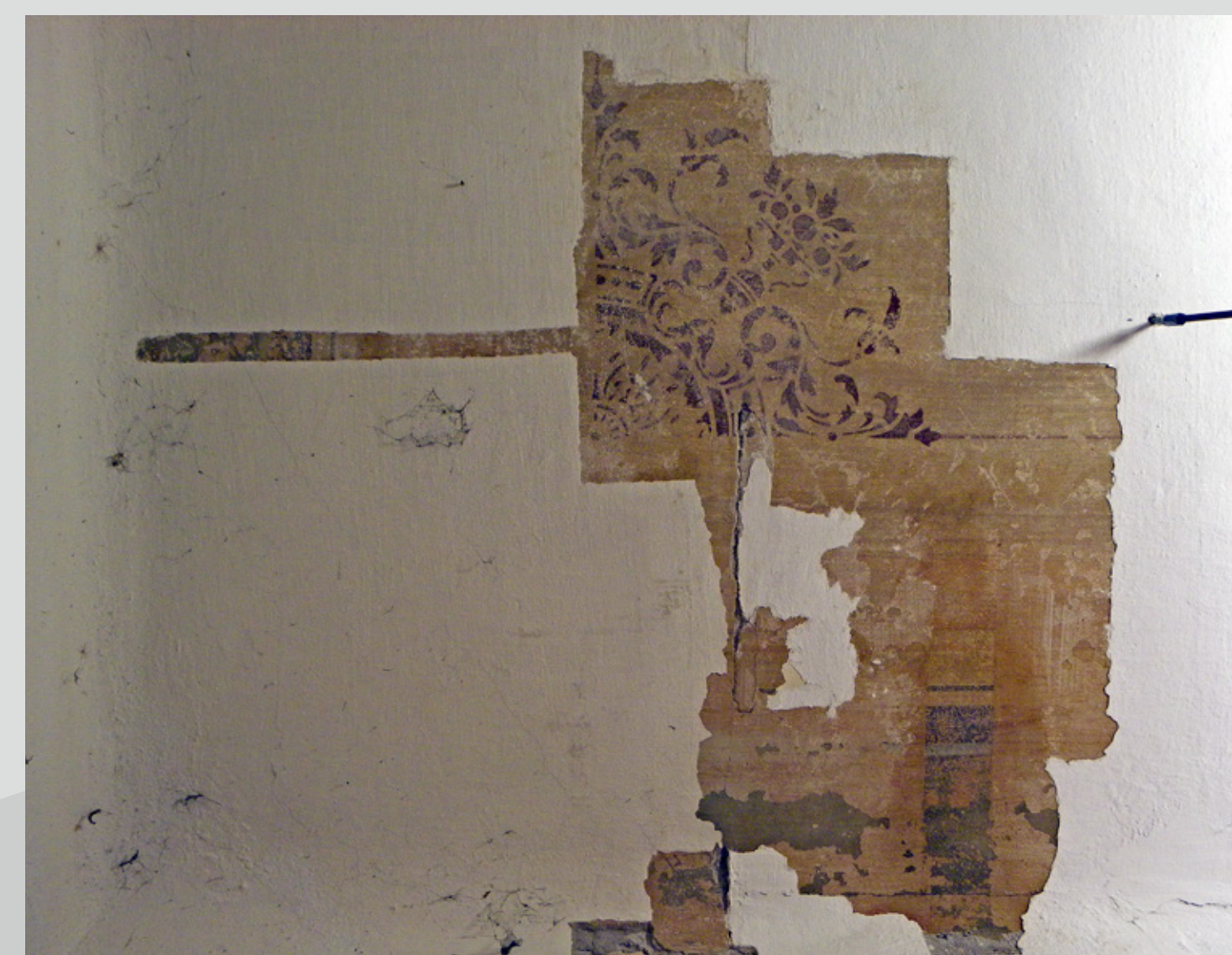
Slika 2: Postopno odstranjevanje plasti beležev je razkrilo dobro ohranjeno šablonsko dekoracijo in borduro.