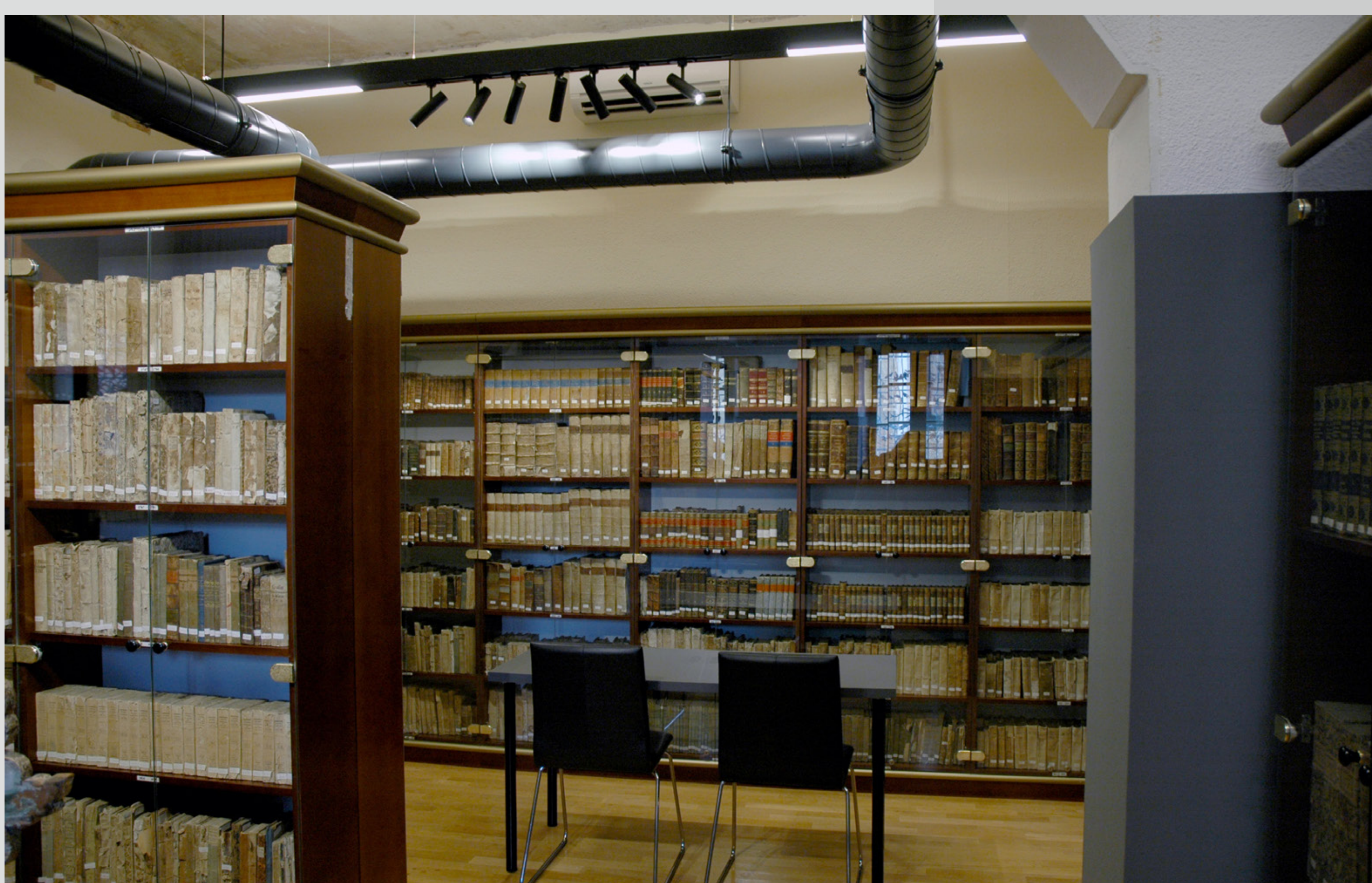
Slika 7: Končna podoba obnovljenega prostora, preurejenega v knjižnico.