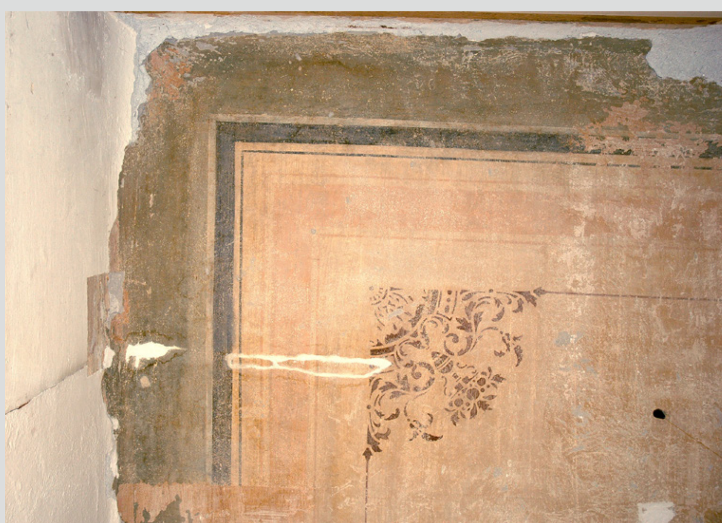
Slika 5: Vzorčno polje vogalne dekoracije po postopku čiščenja z Wishab gobico.