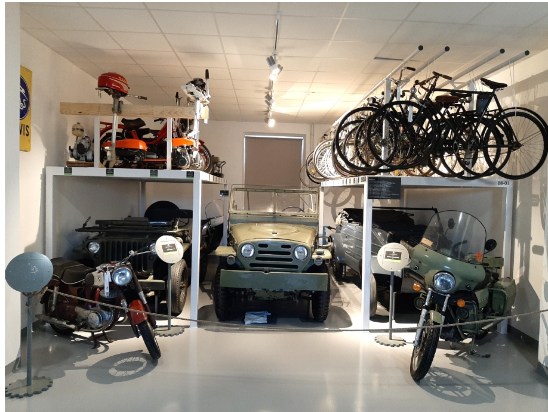
Na razstavi v depoju Pivka

Na vozilu so bila v preteklosti že izvedena manjša ličarska in