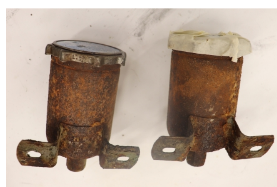
Posodi za zavorno tekočino pred restavriranjem