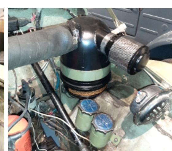
Filter za zrak po restavriranju