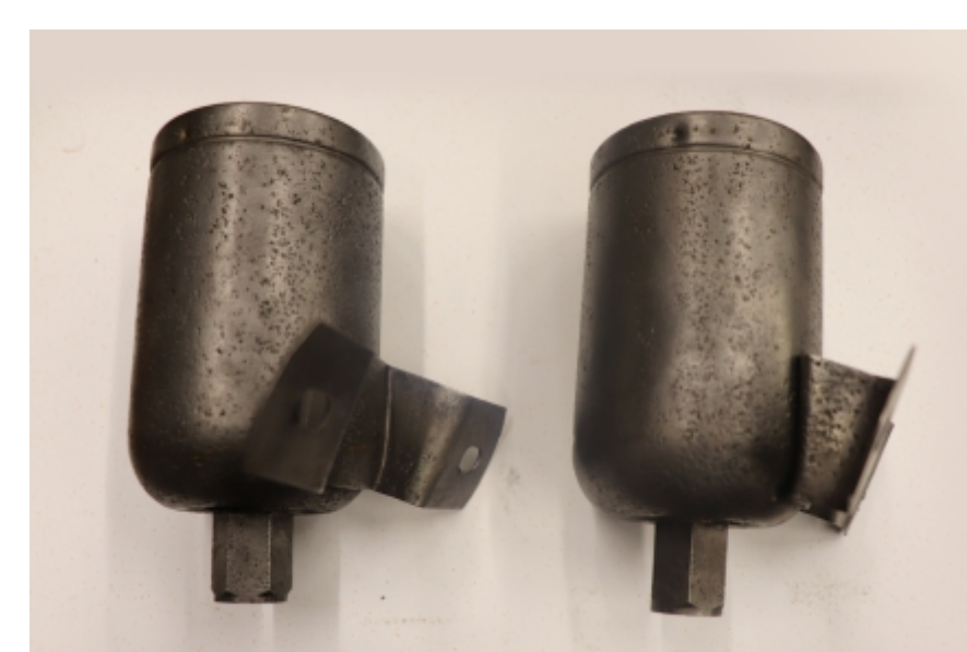
Posodi za zavorno tekočino med restavriranjem