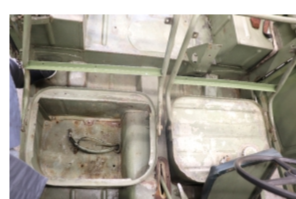
Bencinski rezervoar in prostor za akumulator pred restavriranjem