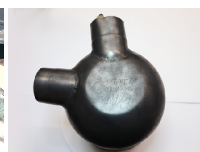
Podpis vojaka na filtru za zrak