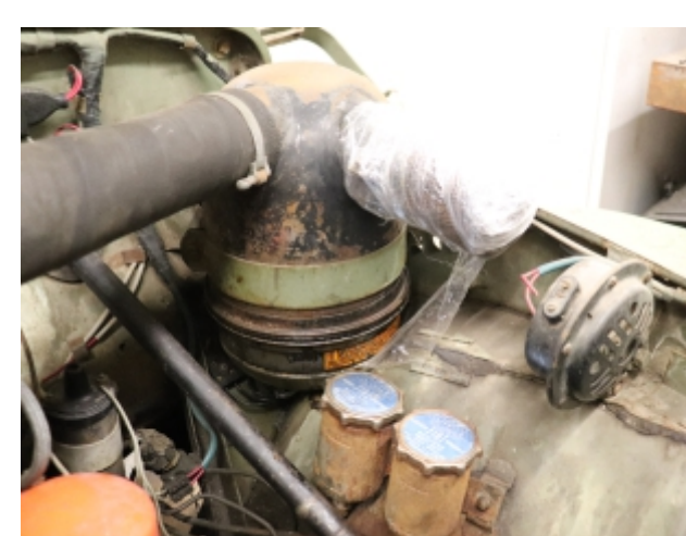
Filter za zrak pred restavriranjem