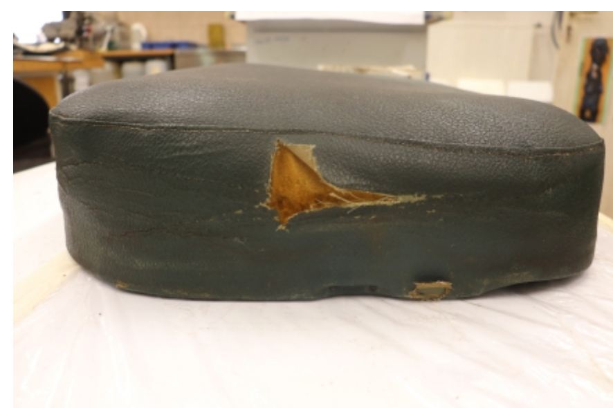
Raztrganine na sedežu