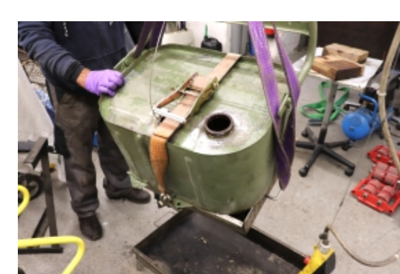
Med čiščenjem notranosti rezervoarja