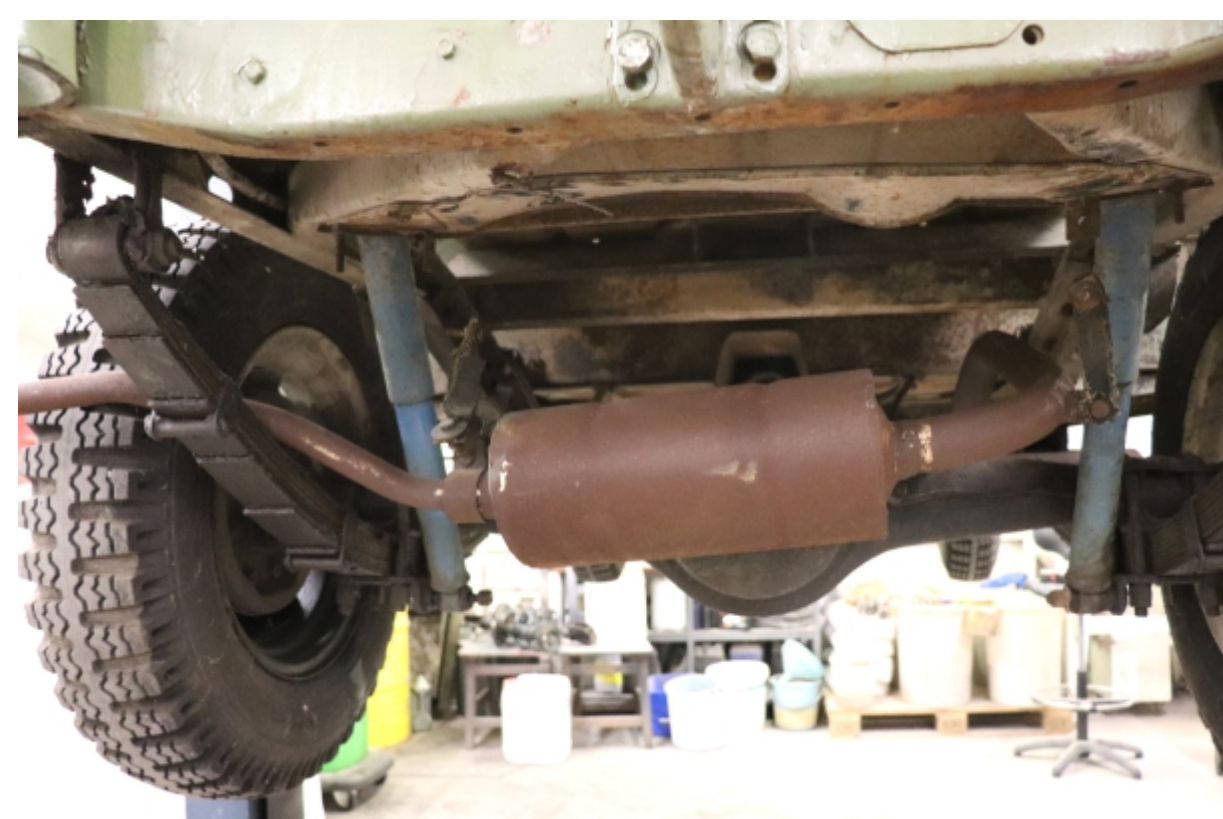
Korozijska poškodba na podvozju in izpušnem loncu