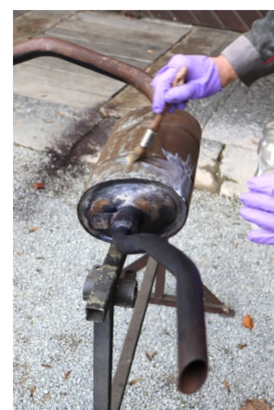
Med konserviranjem izpušnega lonca