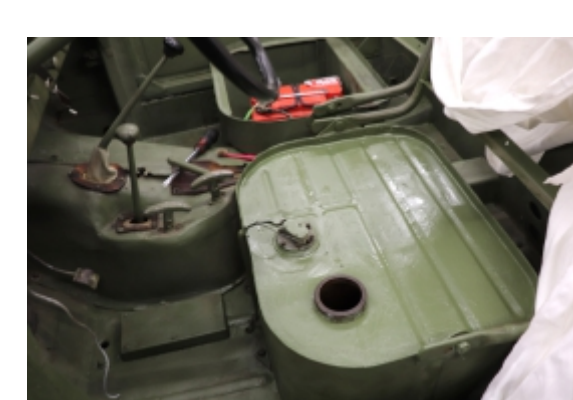
Bencinski rezervoar po restavriranju

mehanska popravila, ostalo pa je v originalnem stanju. Najverjetneje so ga uporabljali do leta 1991. Na števcu je zabeleženih dokaj malo števil kilometrov-15522, zato domnevamo, da se je števec že enkrat zavrtil in je pravo število 115522km. Ker je bilo vozilo v relativno dobrem stanju, večji posegi v karoserijo niso bili potrebni. Notranjost pa je bila precej korodirana in sledovi uporabe so bili povsod močno vidni. Na podlagi analize stanja smo se odločili za ohranitev originalne barve in le za najnujnejše posege v notranjosti, saj smo želeli karseda ohraniti avtentičnost vozila. Morali smo ustaviti vse škodljive procese in predvsem sanirati korozijsko. Posebno zahtevno je bilo retuširanje in restavriranje notranjosti. V celoti pa smo tudi konservirali podvozje in šasijo. V delavnici Etnografskega muzeja smo z njihovo pomočjo restavrirali prevleke na zadnjih sedežih, ki so narejene iz impregniranega tekstila in pene.