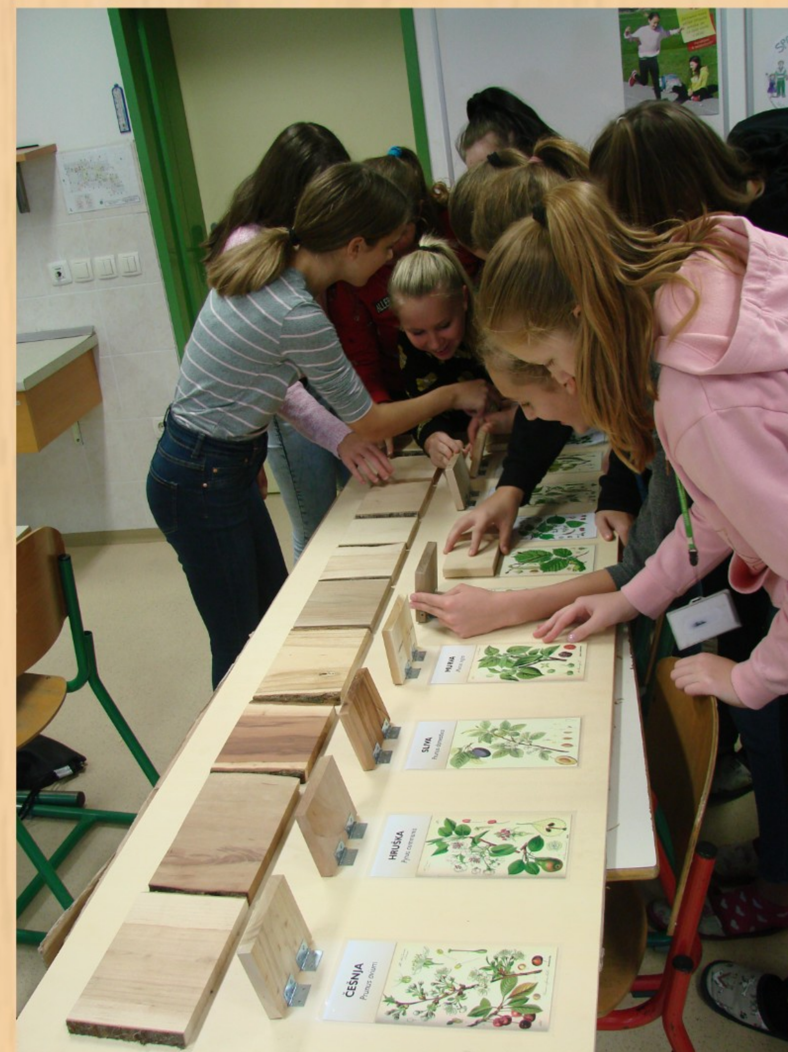
Spoznavanje drevesnih vrst s pomočjo animacijske table z vzorci različnih drevesnih vrst.