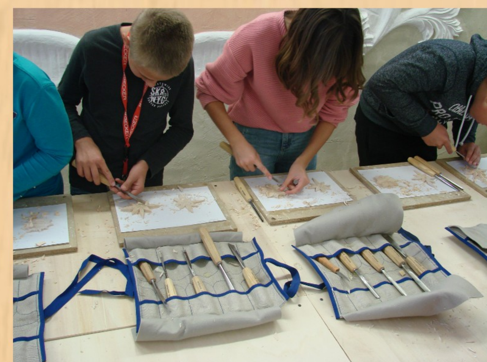
Učenci so z uporabo različnih dlet rezbarili v tehniki globokega reliefa.