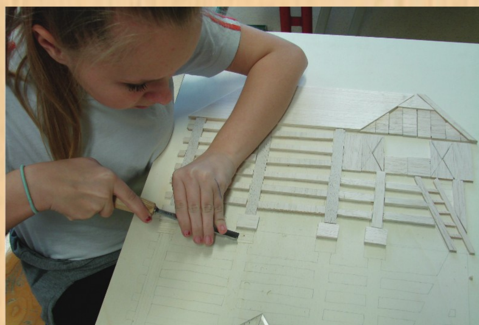
Vrezovanje linij odseva v vezano ploščo po izdelani predlogi.