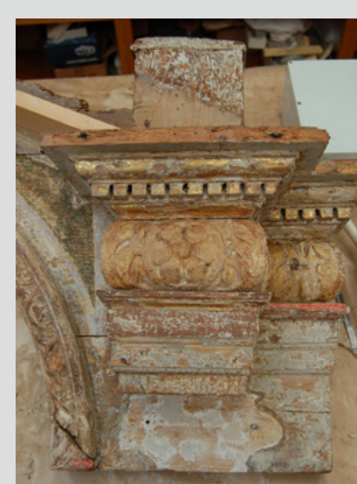
2. površina po odstranitvi preslikav ter utrjevanju