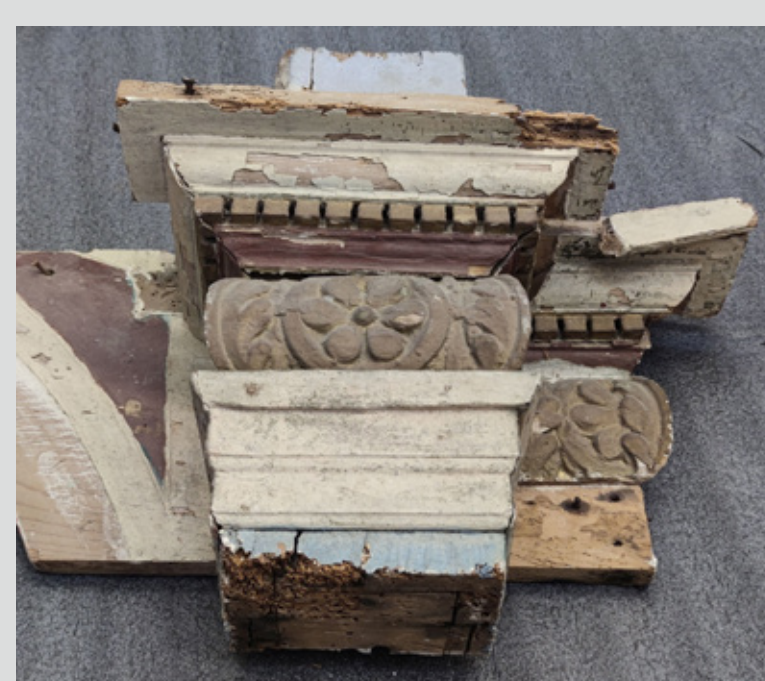
1. stanje pred posegom