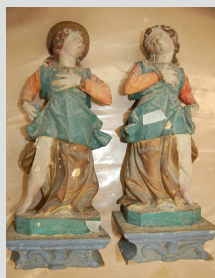
Slika 12: Manjša kipa svečenoscev pred posegom.