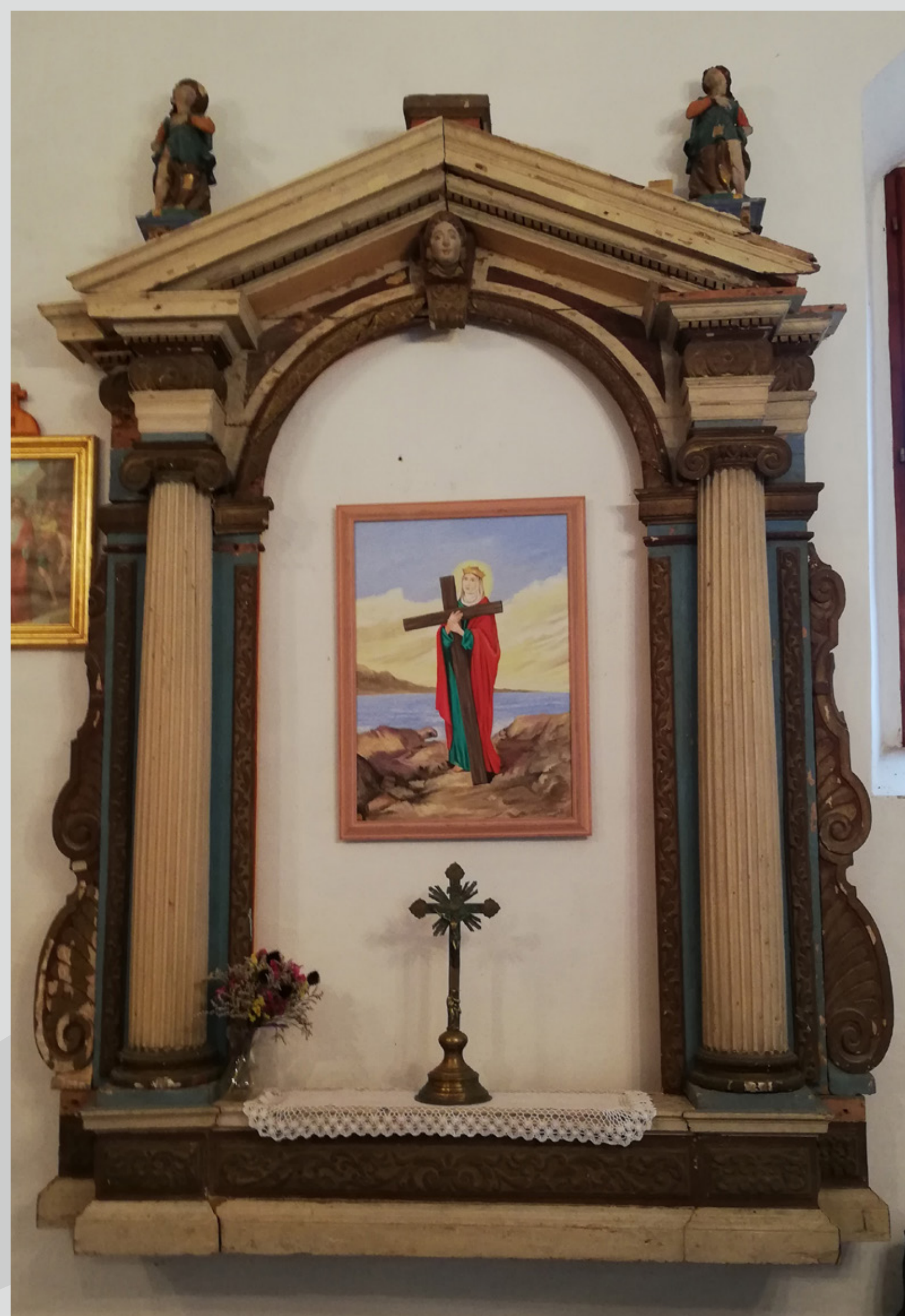
Slika 1: Oltar pred posegom.

Za postavitev oltarja je bila po meri izdelana masivna lesena konzola, pritrjena na steno.