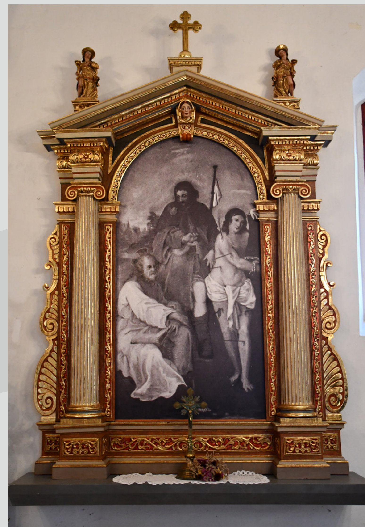
Slika 2: Oltar po končanem konservatorsko-restavratorskem posegu.