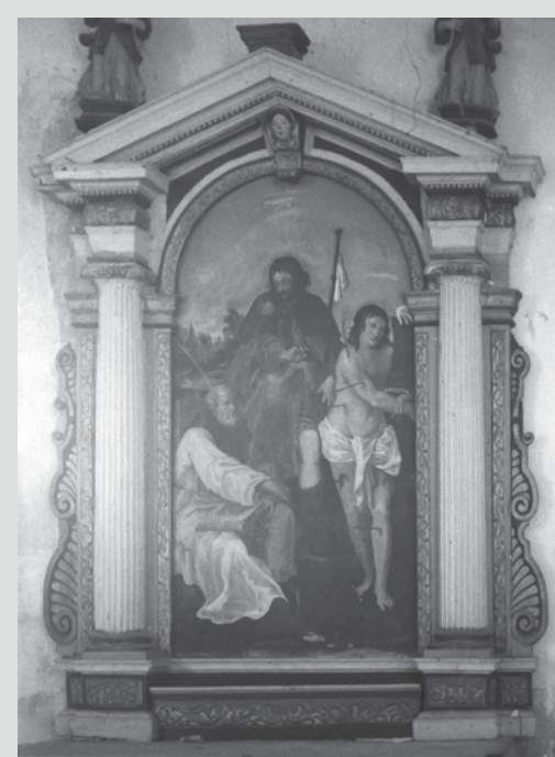
Slika 3: Fotografija iz dokumentacije ZVKDS OE Piran, na kateri je še ohranjena oltarna slika.