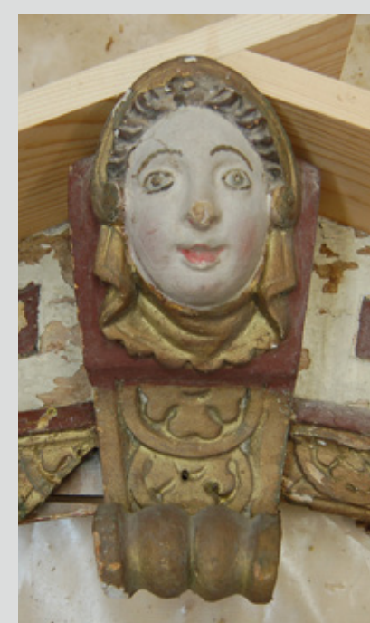
Slika 4: Detajl stanja pred posegom.