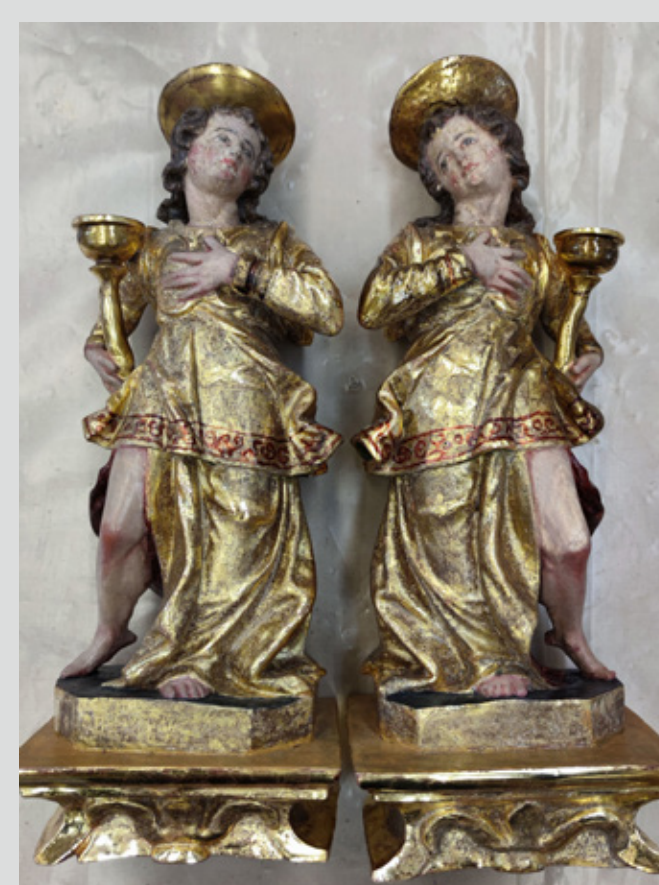
Slika 13: Kipa po postopku dopolnjevanja pozlate. Pri sondiranju slikovnih plasti je bila odkrita dobro ohranjena pozlata ter z rdečo lazuro naslikani rastlinski vzorci.