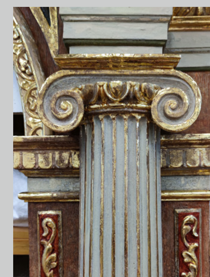
Slika 15: Detajl po posegu.