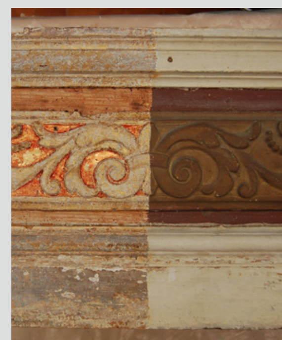
Slika 5: Detajl spodnje predele, med postopkom odstranjevanja preslikav.