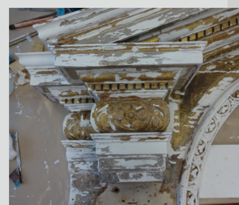
3. po dopolnjevanju manjkajočih letvic ter grundiranju