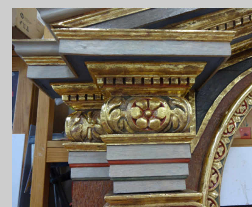
4. po posegu