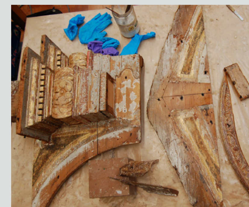
Slika 6: Čiščenje in utrjevanje posameznih kosov.