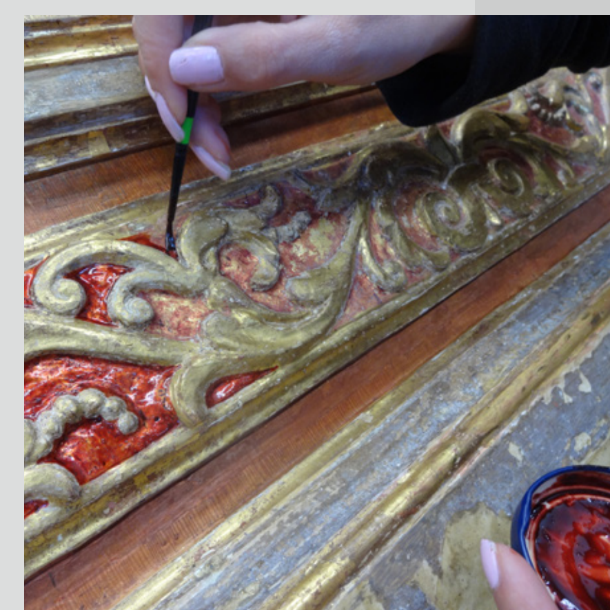
Slika 14: Regeneracija rdeče lazure.