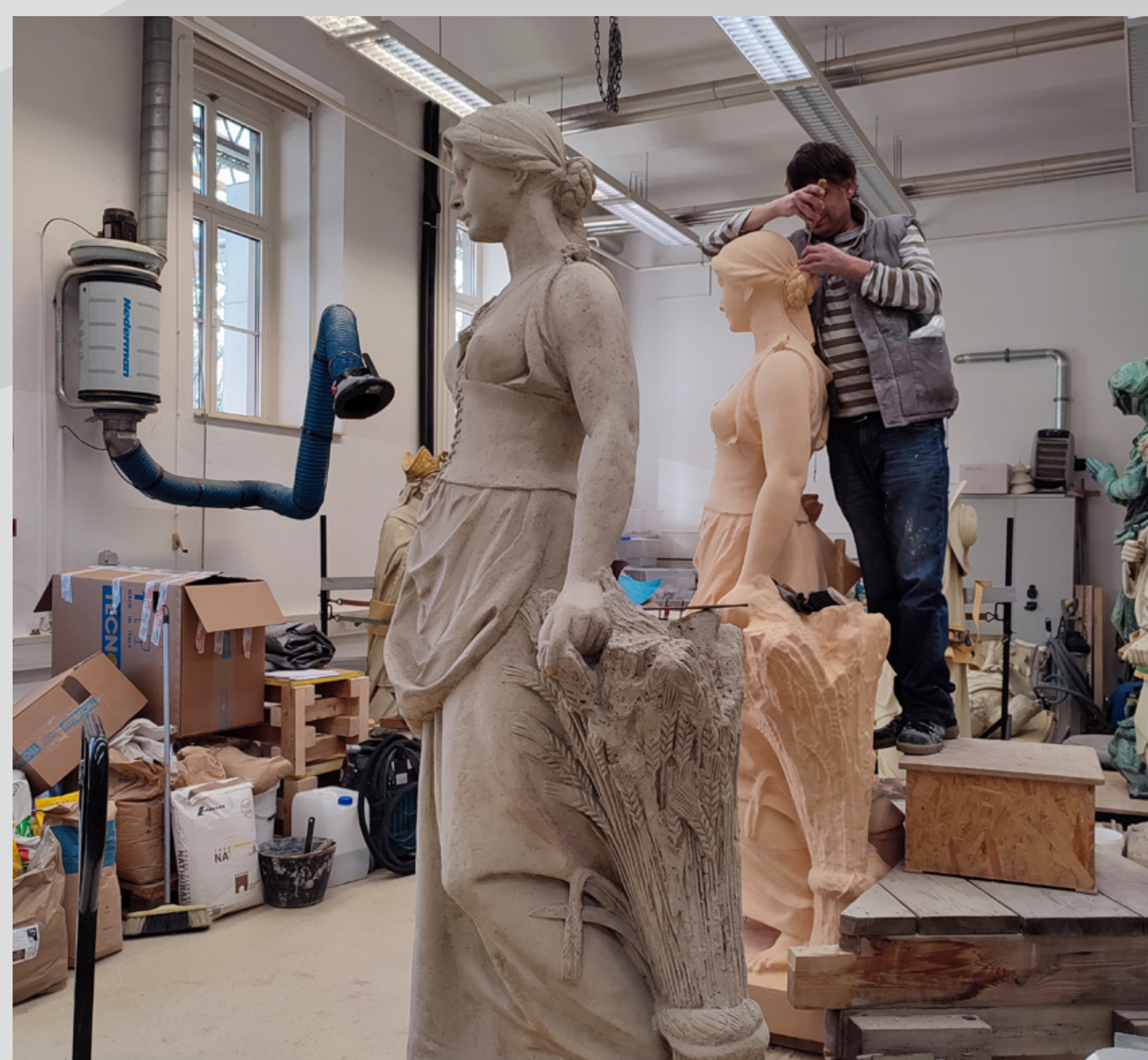
Slika 3: Detajlna rekonstrukcija strukture površine.