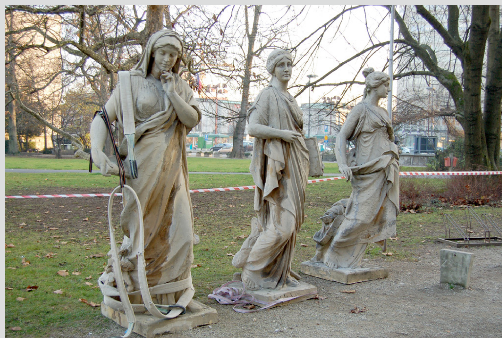
Slika 1: Demontirani kipi.