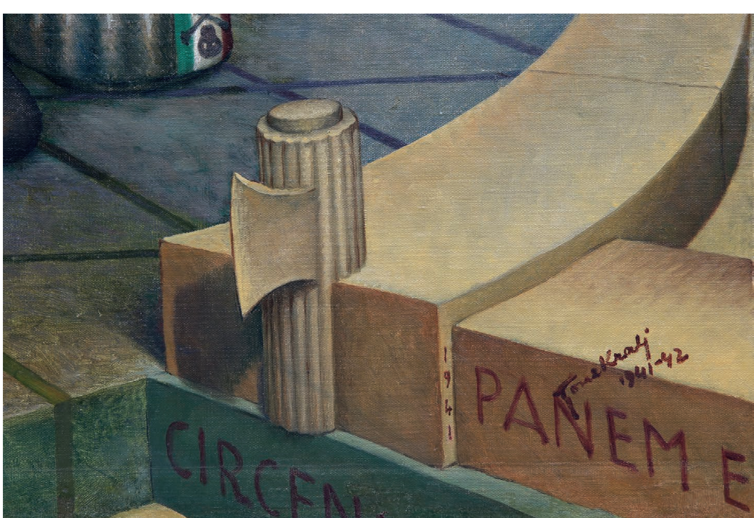
Slika 4 Detajl z avtorjevim podpisom, datacijo in poimenovanjem dela.

Gre za vsebinsko in kompozicijsko kompleksno delo, ki je nastalo v letu 1942, in ki obravnava sočasno politično situacijo in pozicijo posameznikov znotraj nje. Z različnih vidikov spodbuja premislek k (ne)sodelovanju slehernika v kolesju teme kruha in iger , ki je aktualna v različnih zgodovinskih obdobjih. Odpira vprašanja angažmaja posameznika v kritičnih situacijah, njegove vesti, labilnosti, informiranosti in samostojnosti. Poleg tega slika predstavlja zanimiv vpogled in umetnikov komentar vojnega dogajanja, in sicer v realnem času, tako rekoč sočasno z dogodki. Ker je slika vsebinsko bogata, je njena analiza zahtevno delo, ki kliče k interdisciplinarnemu pristopu.