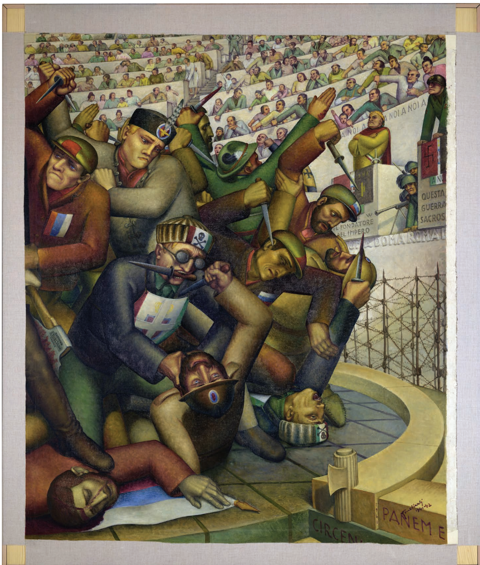
Slika 2 Slika po opravljenih posegih.

Zaradi nejasnih okoliščin nastanka slike in nanosa barvnega premaza smo se soočili z več vprašanji in jasno je bilo, da se moramo podrobnejšega raziskovanja lotiti v sodelovanju z drugimi strokami. V ta namen smo organizirali strokovni posvet, s čimer smo osvetlili tako prednosti kot zadržke pri odstranjevanju premaza. Odločili smo se, da v Restavratorskem centru Zavoda za varstvo kulturne dediščine Slovenije (v nadaljevanju RC) sprva izvedejo raziskave, nato pa odstranijo barvni premaz. Prav delo kolegic mag. Zoje Bajdè in Petre Bešlagić z RC je bilo ključno za celovito analizo slike. Posvetovanja z njima so bila stalnica celotnega procesa konservatorsko-restavratorskih posegov. Med posameznimi fazami smo reševali vprašanja nastanka slike in ikonografije, fizičnega stanja dela in obsega načrtovanih posegov.