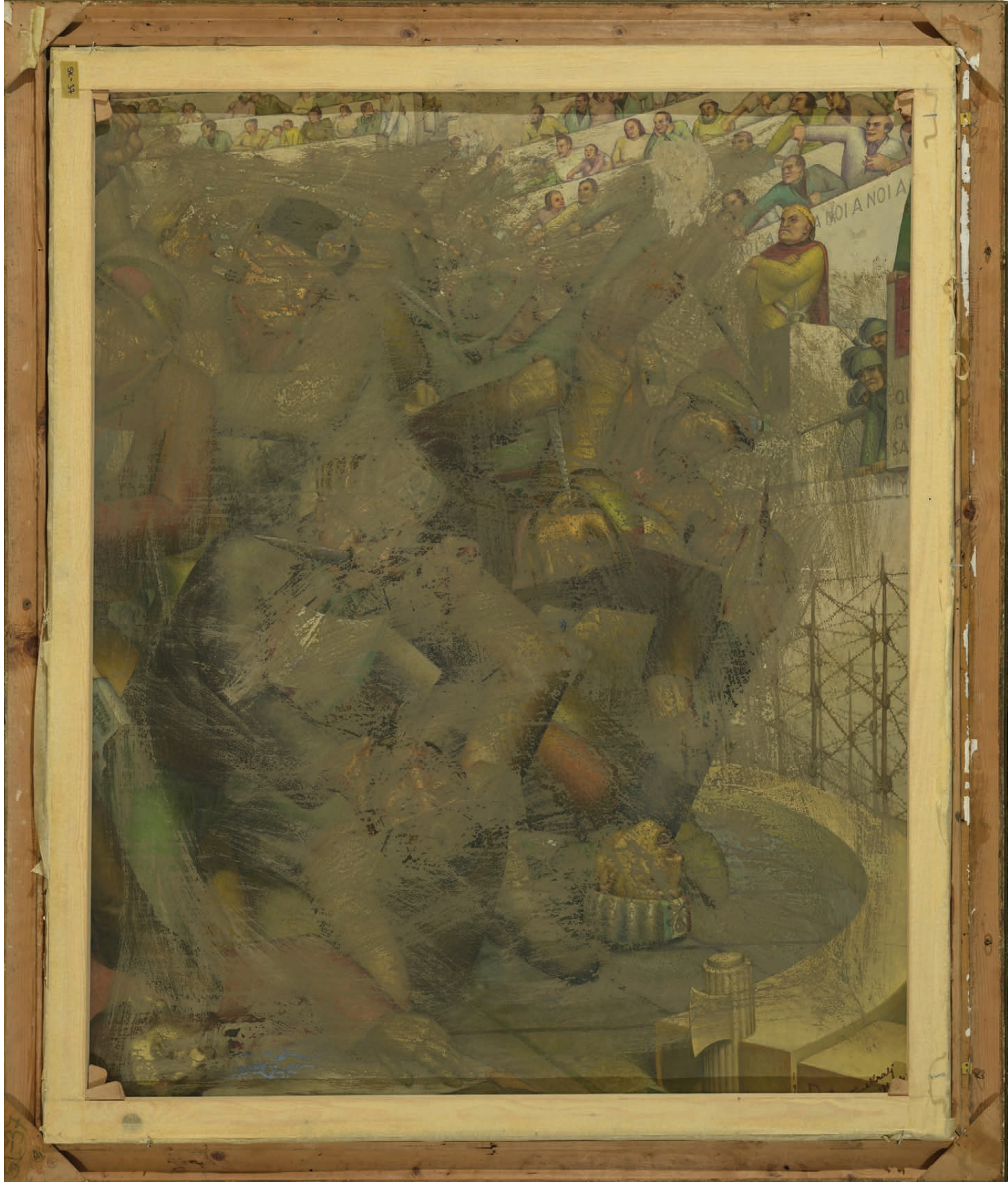
Slika 1 Prvotno stanje dela Panem et circenses .

Slika Toneta Kralja z naslovom Streljanje talcev , 13. 10. 1942 je že dolgo poznana. Najverjetneje je nastala po naročilu v prvih letih po drugi svetovni vojni. Manj znano pa je, da je na hrbtni strani naslikano še eno delo T. Kralja z naslovom Panem et circenses , ki je bilo delno prekrito z barvnim premazom.