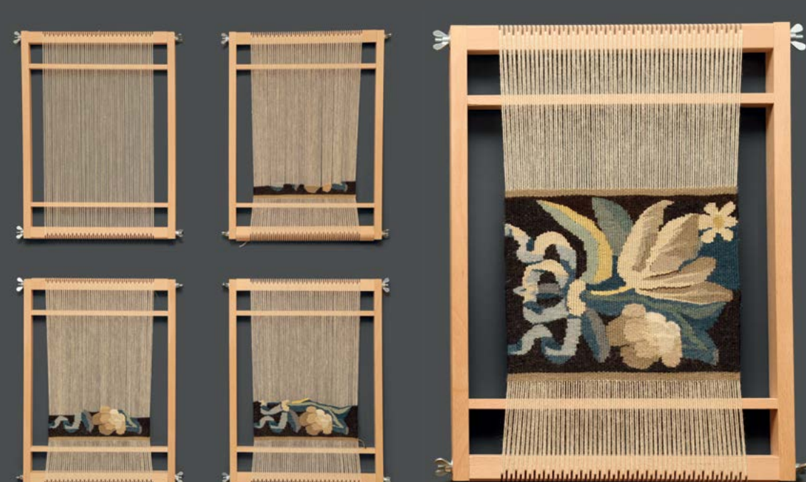
Postopek tkanja po baročni tapiseriji povzetega cvetličnega motiva

Potrudili smo se pripraviti čim bolj interaktiven prikaz, s katerim vabimo k dotikanju in ustvarjanju ter spoznavanju nastanka dragocenih tkanin stenskih preprog.