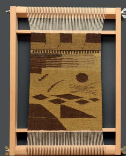
Prikaz različnih osnovnih tehnik tkanja tapiserij

Na začetku predstavimo tekstilna vlakna in njihov izvor ter barvanje tekstila v preteklosti. Sledita panoja »Raznoliki svet tkanin« ter »Lepota in draž historičnih tekstilij«, nadaljujemo s predstavitvijo tapiserij od nastanka do ohranjanja ter zaključimo s predstavitvijo štirih desetletij delovanja konservatorsko-restavratorske delavnice za tekstil.