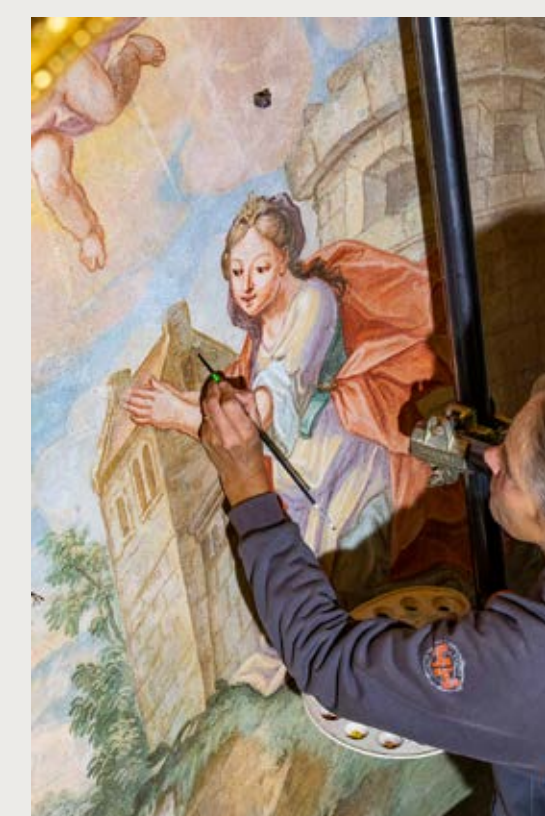
Slika 10: Med retuširanjem.