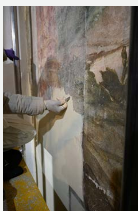
Slika 3: Odstranjevanje beležev.