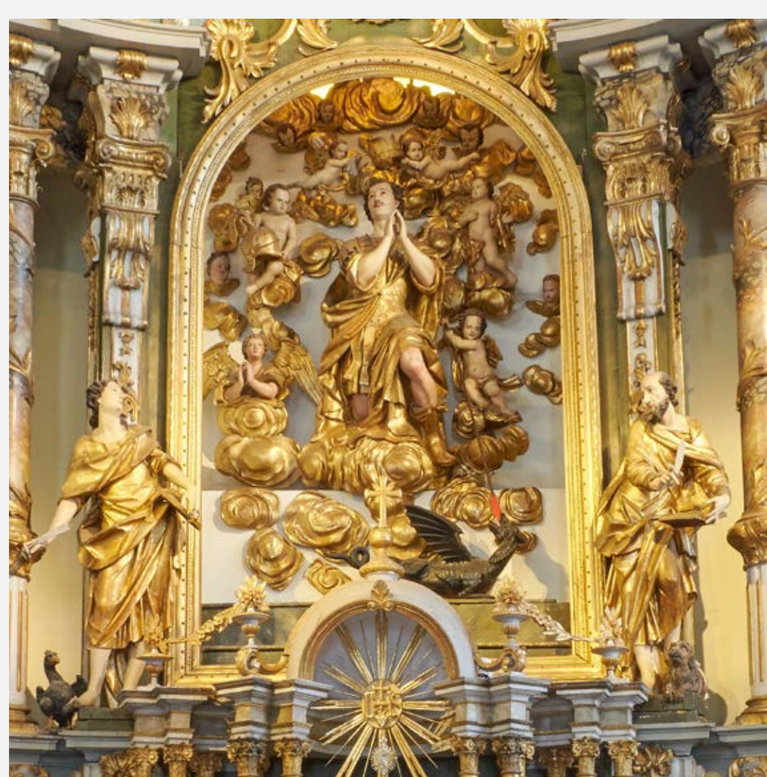
Slika 11: Oltarna niša pred izvedbo posegov. (Poslikava je prebeljena, v oltarju je Šubičev kip z angelci).