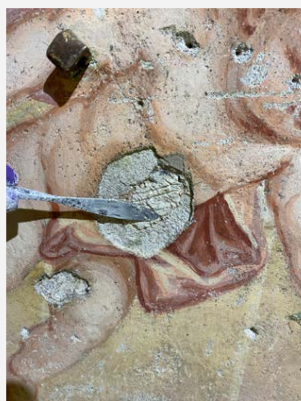
Slika 6: Grobo kitanje poškodb v ometu.