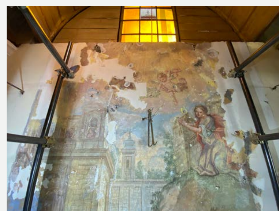
Slika 4: Pogled na poslikavo med odstranjevanjem beležev.