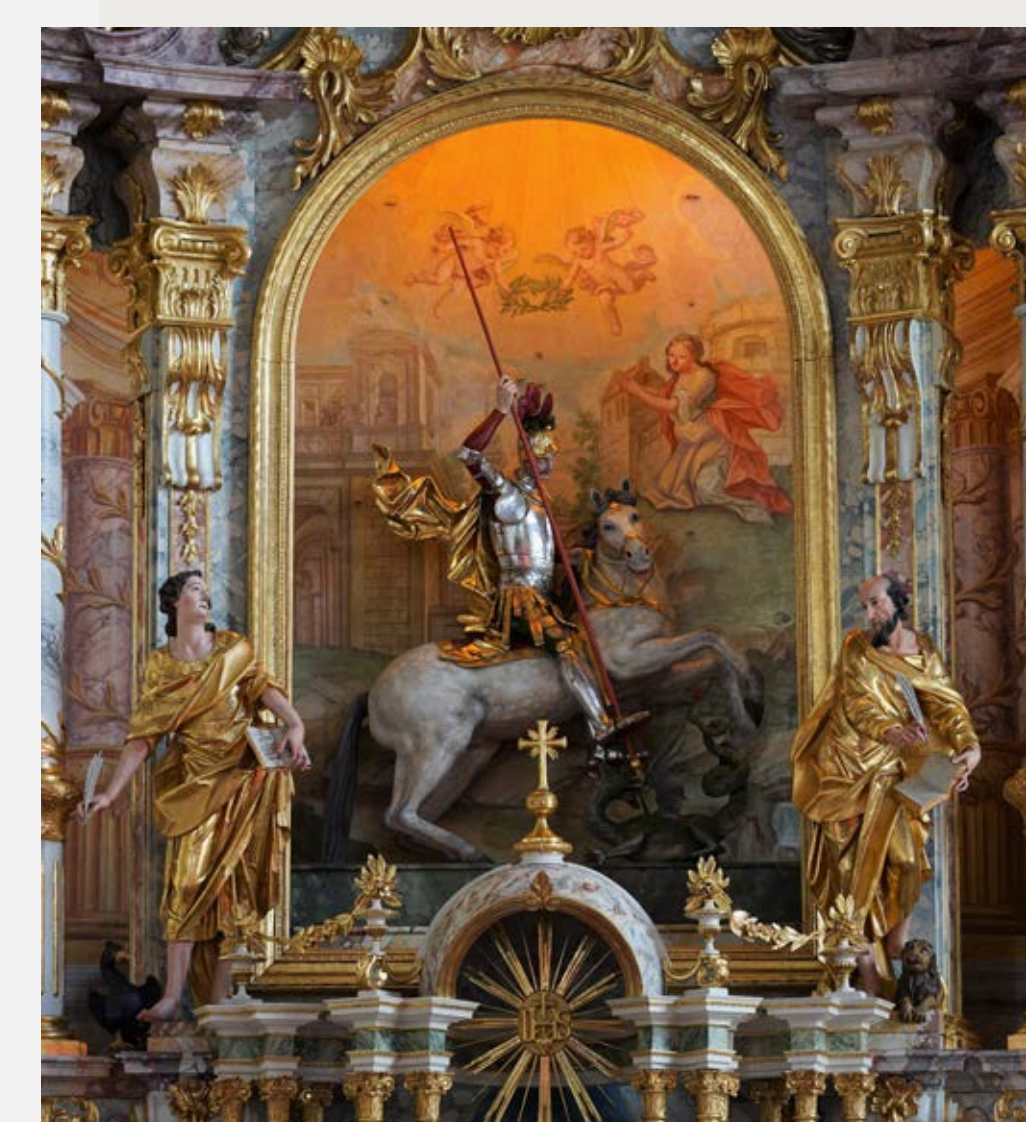
Slika 13: Oltarna niša po izvedbi posegov. V oltarju je prvotni baročni kip, za njim odkrita poslikava.