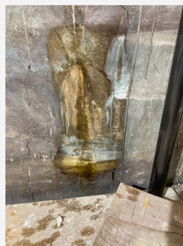
Slika 8: Med odstranjevanjem preslikav.