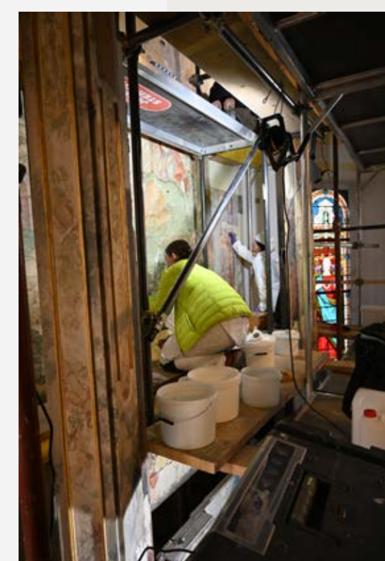
Slika 9: Delovišče.