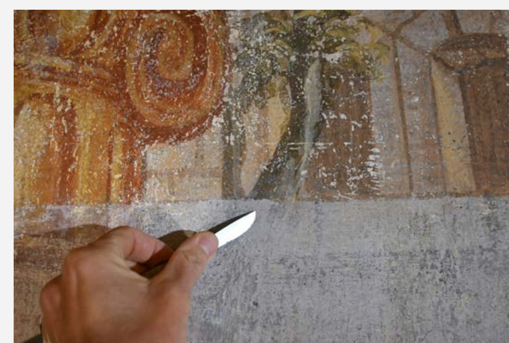
Slika 5: Med odstranjevanjem zasigane plasti beležev.