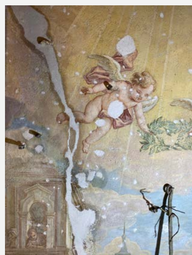
Slika 7: Del poslikave po kitanju.