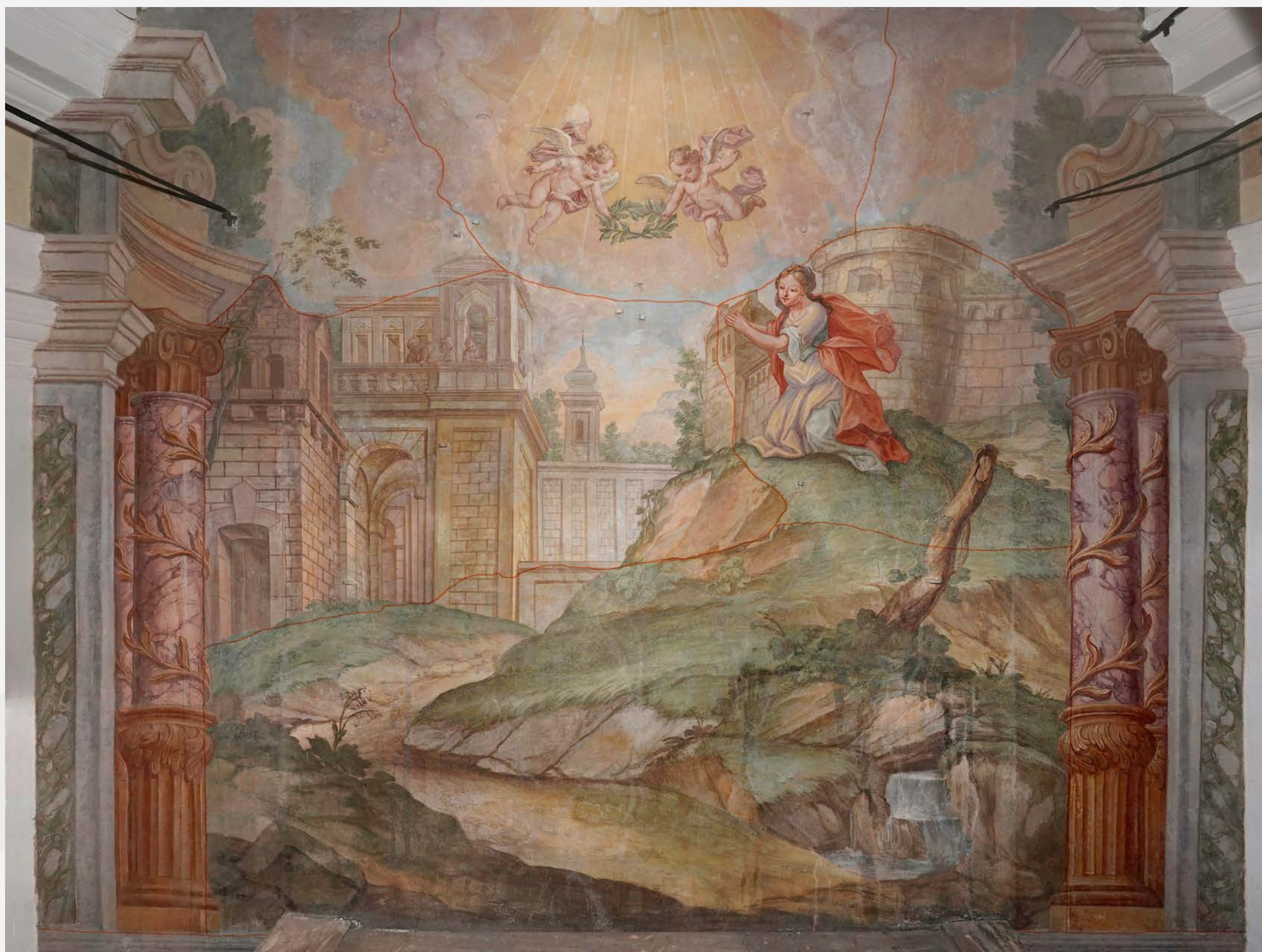
Slika 1: Foto-zloženka odkrite in restavrirane poslikave z označenimi dnevnicami.