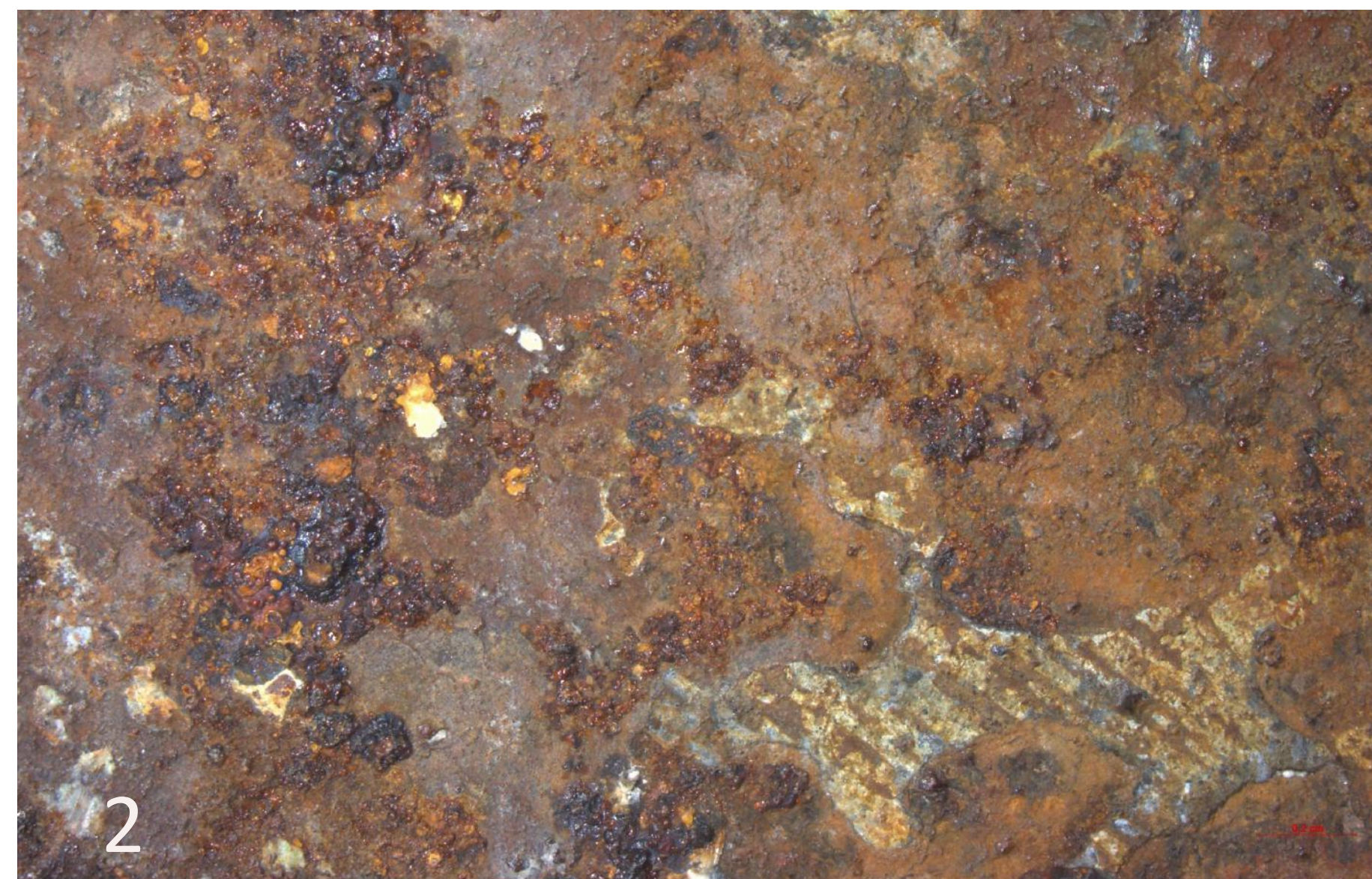
Slika 1: Uporaba MiCorr vprašalnika za identifikacijo kovine med strokovnimi delavnicami v Neuchâtelu, januar 2023