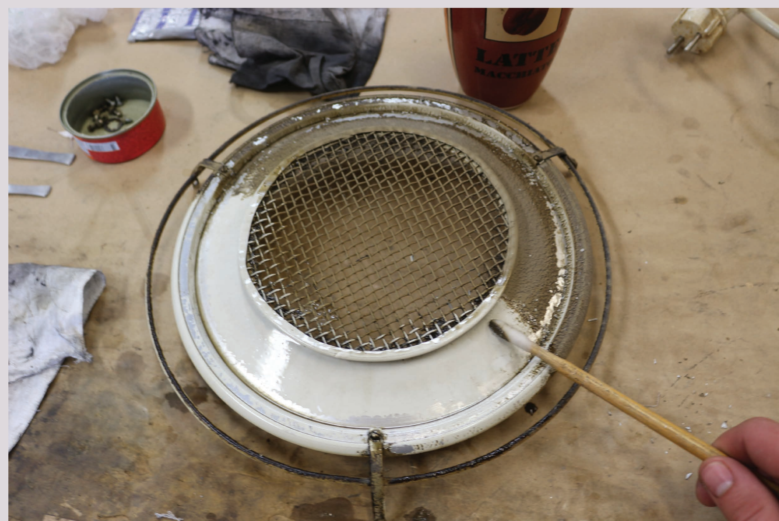
Detajl 'havbe' med posegi