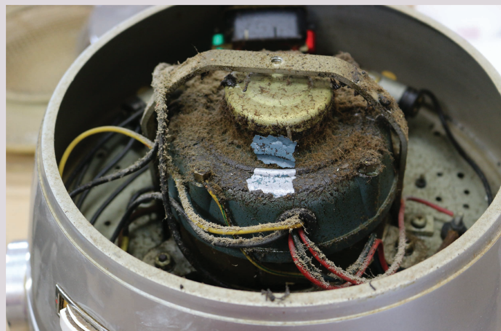
Detajl 'havbe' pred posegi