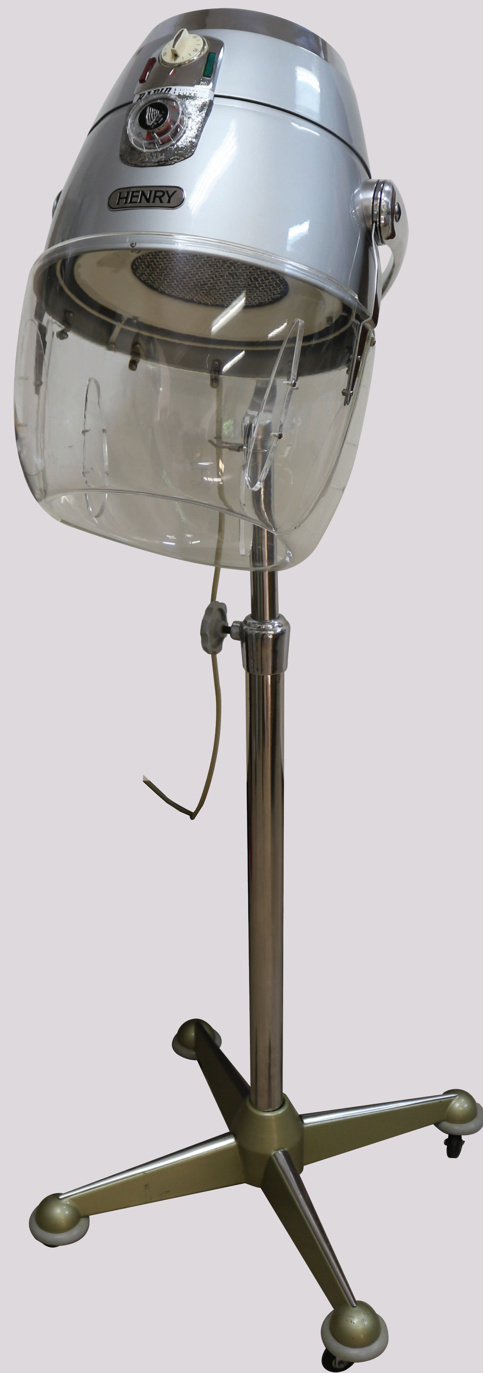
Samostoječa, premična havba za sušenje las proizvajalca Henry