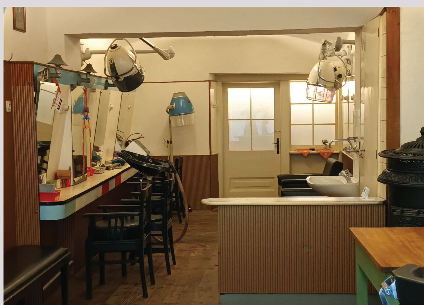
Brivsko-frizerski salon Kreutz po posegih

Pri konserviranju in restavriranju predmetov smo tako obravnavali materiale kot so les, kovina, steklo, usnje, lasje, plastika, tekstil, guma in papir. Večina predmetov je bila dobro ohranjenih, zato smo na teh odstranili le površinske nečistoče in korozijske produkte. Bolj poškodovane je bilo treba tudi restavrirati (npr. leseni stoli, usnjene blazine, plastična kapa za izdelavo pramenov ...).