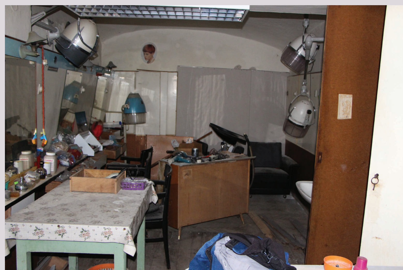
Brivsko-frizerski salon Kreutz pred posegi