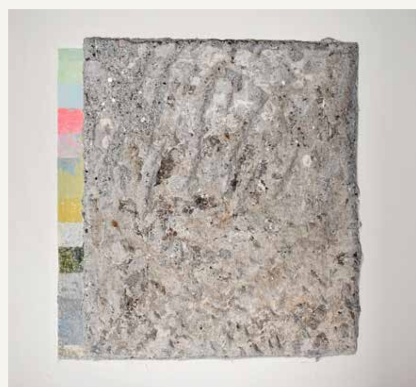
Prezentirana sonda na steni s prikazanimi ohranjenimi opleski ter plast renesančne plasti z ostanki stenske poslikave.