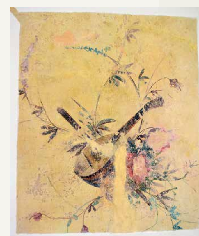
Stropna poslikava z nevtralnno retušo.