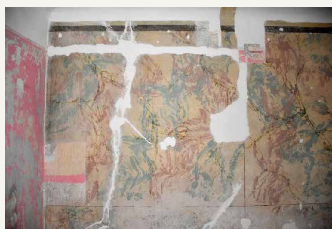
Del stenske poslikave po končanem kitanju poškodb.