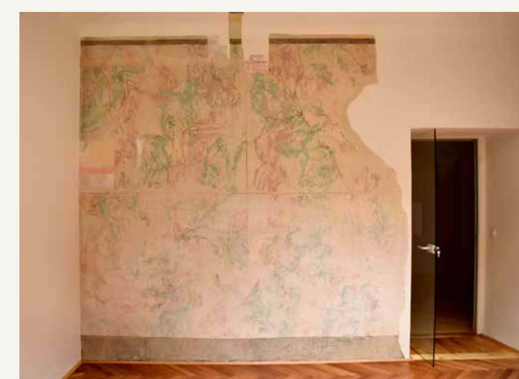
Končna prezentacija stenske poslikave z naslikanim marmorinom.