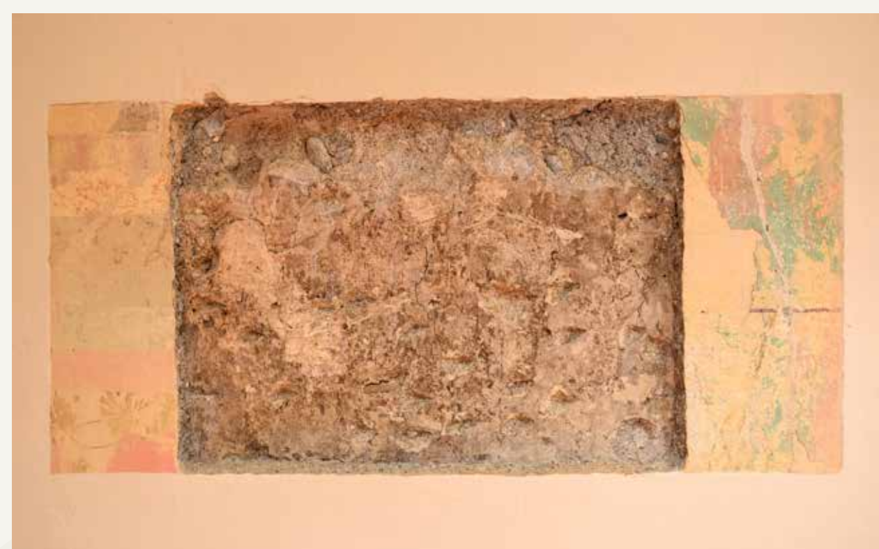
Prezentirana sonda na steni s prikazanimi ohranjenimi opleski ter plast renesančne plasti.