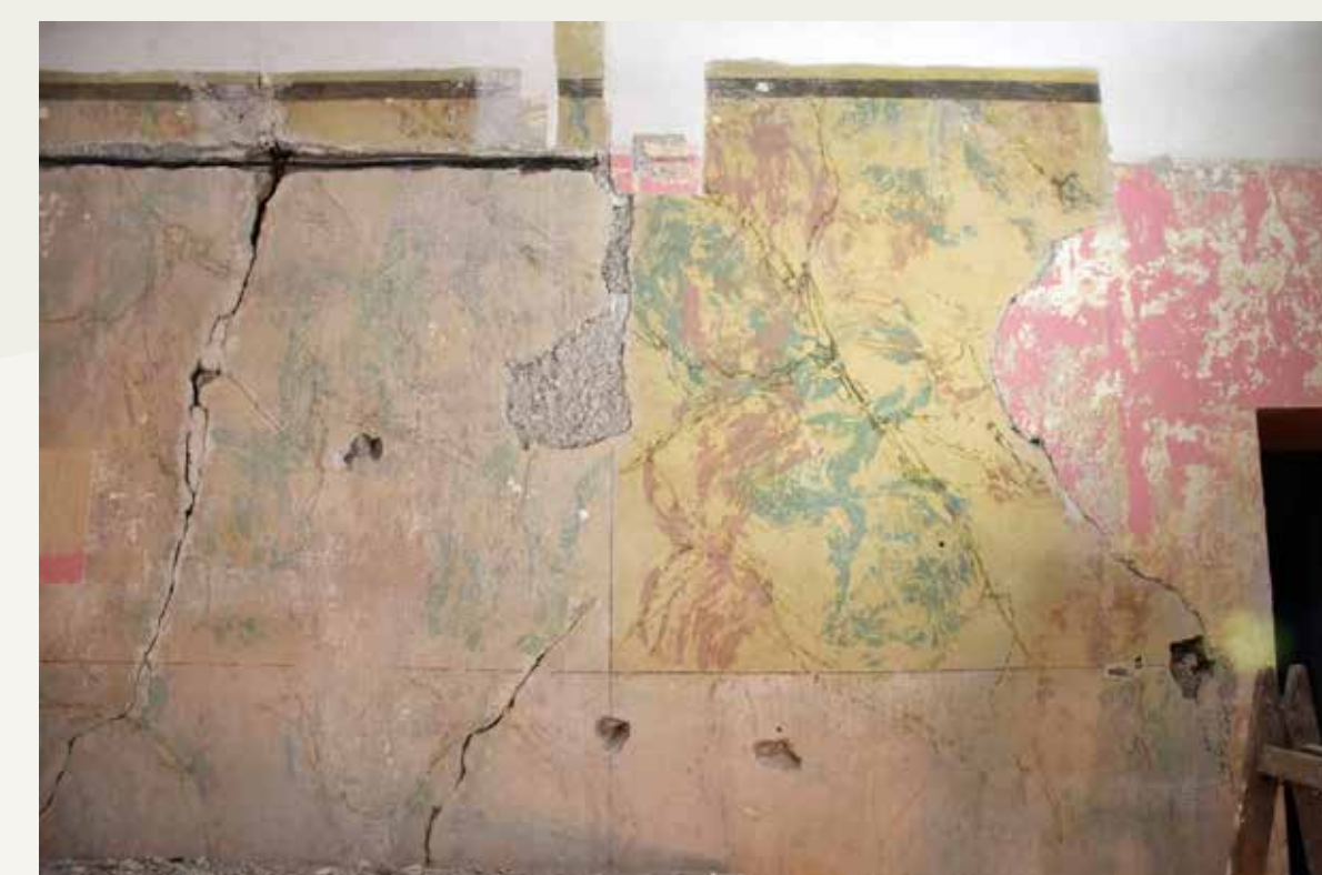
Stanje stenske poslikave med posegi (vidne so poškodbe in vzorec finega čiščenja).

Konservatorsko-restavratorski posegi na stenskih poslikavah so se odvijali v dveh fazah, v sklopu celovite obnove stanovanja v prvem nadstropju hiše. V prvi fazi so bile izvedene temeljite sondažne raziskave, ki so pripomogle k načrtovanju celostne prenove. Osnovno vodilo pri načrtovanju obnove je bilo ohranitev ključnih kulturno zgodovinskih elementov ter minimalna posodobitev prostorov za zagotovitev njihove sodobne uporabe kot pisarne ter za izobraževalne prostore Šole prenove. V sklopu celovite prenove so bili v drugi fazi izvedeni minimalni konservatorsko-restavratorski postopki, ki so bili potrebni za fragmentarno prezentacijo stenskih poslikav s poudarkom na konserviranju ter poučnem pristopu prikaza posameznih ohranjenih zgodovinskih plasti kot tudi konservatorskih postopkov obnove.