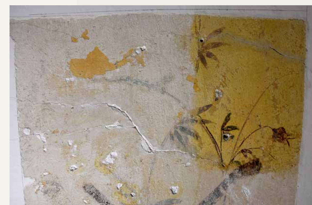
Detajl stropne poslikave med utrjevanjem in vzorcem finega čiščenja.