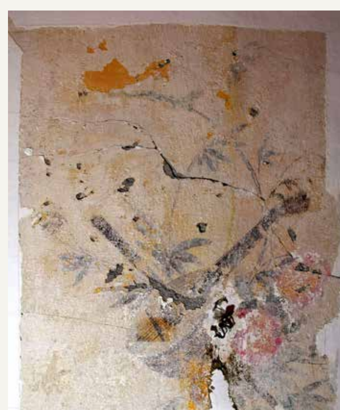
Stropna poslikava med odkrivanjem, vidnih je več poškodb.