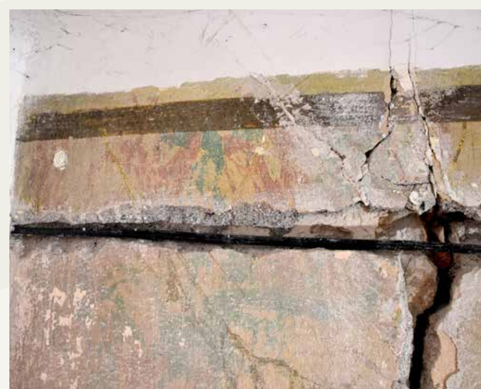
Med odkrivanjem stenske poslikave ter med odstranjevanjem neustreznih plomb.