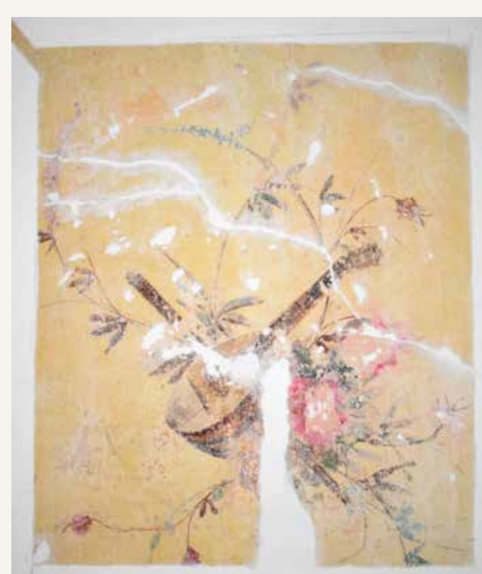
Stropna poslikava po končanem kitanju.