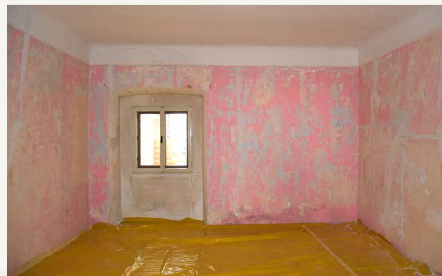
Mestni trg 35, soba v stanovanju v I. nadstropju z odkrito poslikavo imitacije marmorina na stenah ter stropnim tihožitjem z glasbili in cvetjem.

Hiša mestni trg 35 v Škofji Loki, znana tudi kot Loški rotovž, je umeščena v sredino strnjene zahodnega stavbnega niza Mestnega trga. Po značilnostih in tipologiji stavbne zasnove sicer ne izstopa iz stavbne sheme večine hiš na Placu, vendar ji poseben pečat daje v celotnem obsegu poslikana fasada iz druge polovice 17. stoletja, kar stavbo opredeljuje kot izjemno. Hiša je grajena z dvema stavbnima enotama, z notranjim arkadnim dvoriščem ter vhodno vežo ob strani. Stavbni enoti povezuje renesančni križasto obokan arkadni hodnik.