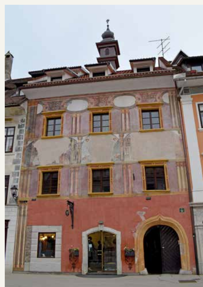
Škofja Loka - hiša Mestni trg 35.

Hiša mestni trg 35 v Škofji Loki, znana tudi kot Loški rotovž, je umeščena v sredino strnjene zahodnega stavbnega niza Mestnega trga. Po značilnostih in tipologiji stavbne zasnove sicer ne izstopa iz stavbne sheme večine hiš na Placu, vendar ji poseben pečat daje v celotnem obsegu poslikana fasada iz druge polovice 17. stoletja, kar stavbo opredeljuje kot izjemno. Hiša je grajena z dvema stavbnima enotama, z notranjim arkadnim dvoriščem ter vhodno vežo ob strani. Stavbni enoti povezuje renesančni križasto obokan arkadni hodnik.